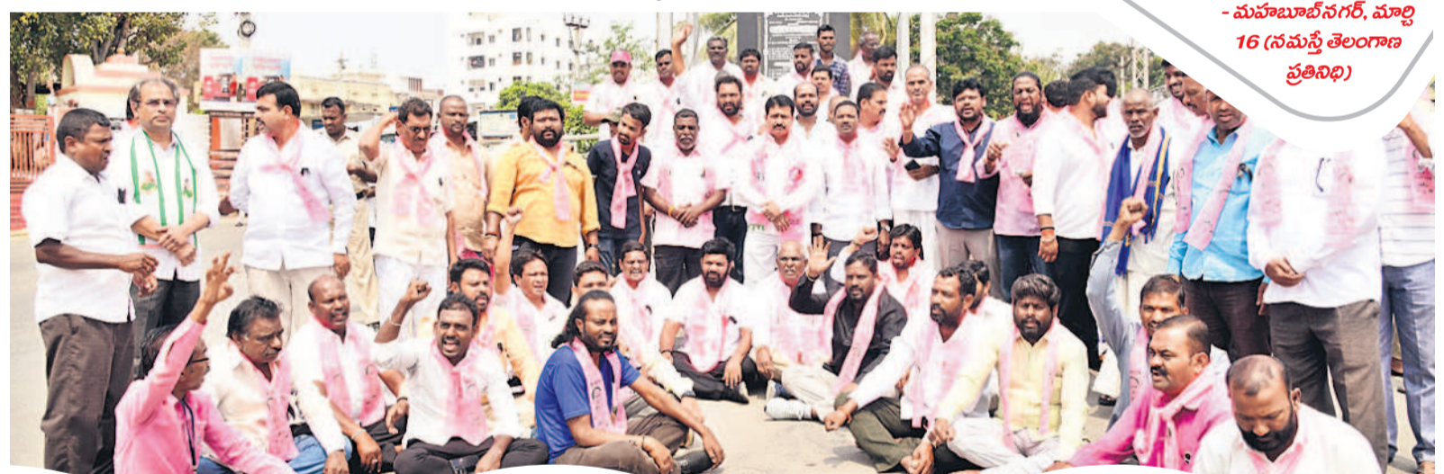
మహబూబ్ నగర్ లో..

- మహబూబ్ నగర్, మార్చి 16 (నమస్తే తెలంగాణ ప్రతినిధి)