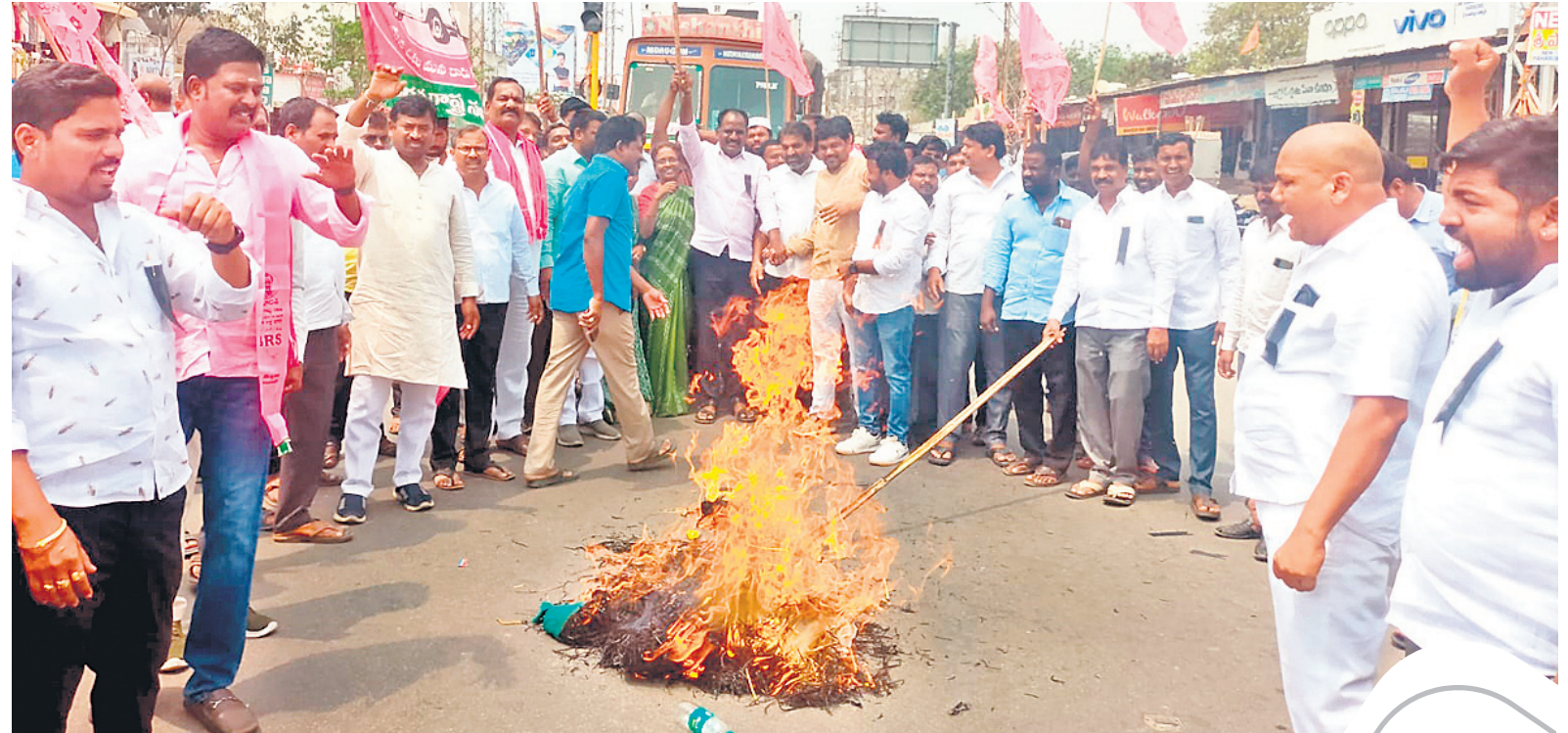
కల్వకుంట్ల పట్టణంలో కేంద్ర ప్రభుత్వ దిష్టిబొమ్మను దహనం చేస్తున్న బీఆర్ఎస్ నాయకులు