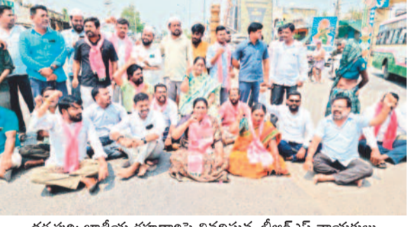
ధర్మపురి: జాతీయ రహదారిపై నిరదిస్తున్న బీఆర్ఎస్ నాయకులు