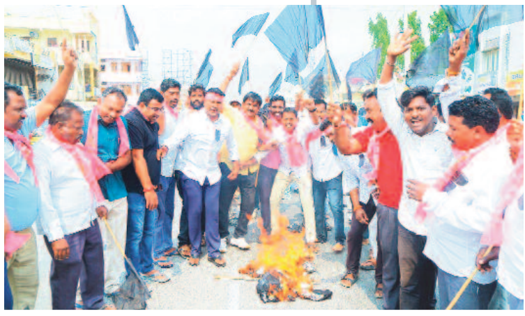
చొప్పదండి: మోడీ దిష్టిబొమ్మను దహనం చేస్తున్న బీఆర్ఎస్ నాయకులు

3 కలీంగర్, ఆదివారం 17 మార్చి 2024 KARIMNAGAR