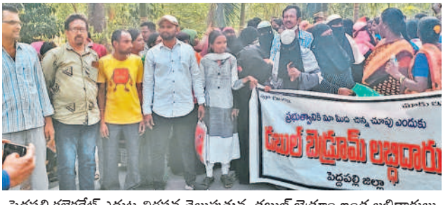
పెద్దపల్లి కలెక్టరేట్ ఎదుట నిరసన తెలుపుతున్న డబుల్ బెడ్రూం ఇండ్ల లబ్ధిదారులు