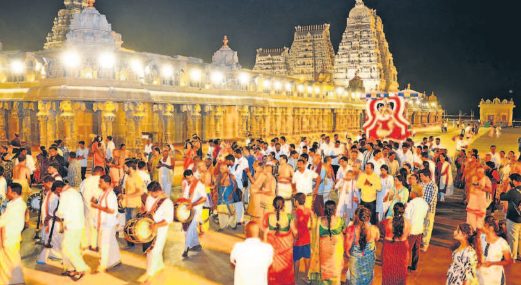
యాదగిరి గుట్ట లక్ష్మీనరసింహస్వామి తిరుకల్యాణ బ్రహ్మోత్సవాలు అత్యంత వైభవంగా జరుగుతున్నాయి. స్వామివారి అలంకార సేవోత్సవంలో భాగంగా గురువారం నృసింహస్వామి ఉదయం వటపత్రకాయి అలంకార సేవలో, రాత్రి హంసవాహనంలో ప్రధానాలయ మాడ వీధుల్లో డిఆర్ గారు. భక్తులు పెద్ద సంఖ్యలో తరలివచ్చి స్వామివారిని దర్శించుకున్నారు. - యాదగిరి గుట్ట