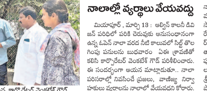
నాలాల్లో వ్యర్థాలు వేయవద్దు

బాలులోకి వస్తే చెరువుల్లోకి మురుగునీరు చేర దని.. తద్వారా చెరువులన్నీ స్వచ్ఛమైనవీటితో కళకళలాడుతాయన్నారు. పర్యావరణ పరిరక్షణ కోసం మహానగరంలో భవిత్యం అవసరాలను దృష్టిలో పెట్టుకుని చెరువుల నుండి రక్షణపై దృష్టిసారించామని దీనిలో భాగంగానే ప్రధాన చెరువుల వద్ద మరుగు నీటి శుద్ధి కేంద్రాలను ఏర్పాటు చేస్తున్నట్లు తెలిపారు. కూకట్‌పల్లి నియోజకవర్గంలో సుమారు రూ.400కోట్లతో ఎస్టీవీ పనులకు శ్రీకారం చుట్టామన్నారు. ఈ ఎస్టీవీల అందు