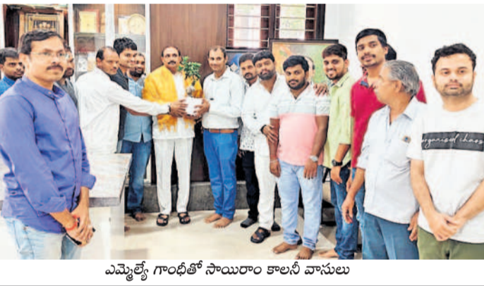
ఎమ్మెల్యే గాంధీతో సాయిరాం కాలనీ వాసులు