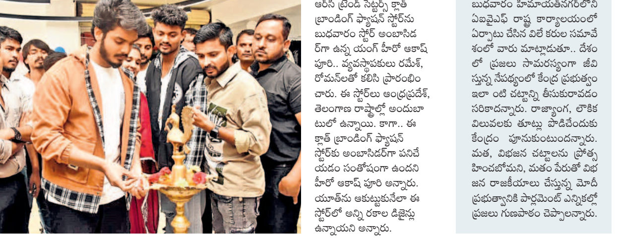
నగరంలోని మూసాపేటలో ఆర్ సి ట్రెండీస్ సెంటర్స్ ఫ్యాషన్ స్టోర్ ప్రారంభం