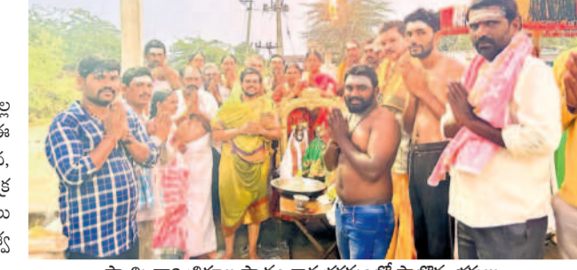
స్వామి వారి త్రిశూల స్థానం కార్యక్రమంలో పాల్గొన్న భక్తులు