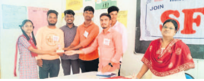
అధిక మార్కులు సాధించిన విద్యార్థి ప్రశంసా పత్రం అందజేస్తున్న ఎన్ఎఫ్ఐ నాయకులు