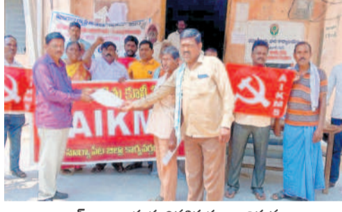
న్యూడెమోక్రసీ, అఖిల భారత రైతుకూలీ సంఘం నాయకులు