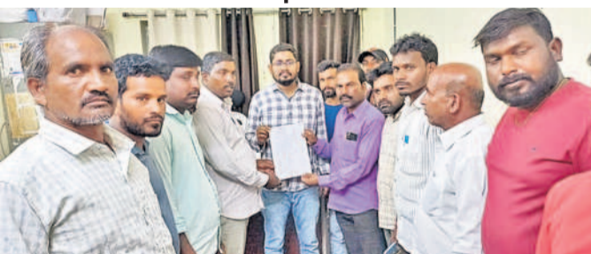
డిప్యూటీ తహసీల్దార్ మధుకు వినతిపత్రం అందజేస్తున్న లింగారెడ్డిగూడ గ్రామస్థులు

షాబాద్, మార్చి 12: శ్మశాన వాటికకు స్థలం కేటాయించాలి లింగారెడ్డిగూడ గ్రామస్థులు మంగళవారం తహసీల్దార్ కార్యాలయంలో వినతిపత్రం అందజేశారు. ఈ సందర్భంగా తహసీల్దార్, సీని లింగారెడ్డిగూడ గ్రామంలో శ్మశాన వాటిక కోసం స్థలం కేటాయించాలని గతంలో కోరగా.. సర్వే నంబర్ 456లో 1.20 ఎకరాల భూమిని చూపించారు. కానీ ఎవరైనా చనిపోతే అక్కడికి మృతదేహాన్ని తీసుకొచ్చే ఇబ్బందులు పెడుతున్నారని ఈ సందర్భంగా తహసీల్దార్, సీని లింగారెడ్డిగూడ గ్రామంలో శ్మశాన వాటిక కోసం స్థలం కేటాయించాలని గతంలో కోరగా.. సర్వే నంబర్ 456లో 1.20 ఎకరాల భూమిని చూపించారు. కానీ ఎవరైనా చనిపోతే అక్కడికి మృతదేహాన్ని తీసుకొచ్చే ఇబ్బందులు పెడుతున్నారని ఈ సందర్భంగా తహసీల్దార్, సీని లింగారెడ్డిగూడ గ్రామంలో శ్మశాన వాటిక కోసం స్థలం కేటాయించాలని గతంలో కోరగా.. సర్వే నంబర్ 456లో 1.20 ఎకరాల భూమిని చూపించారు.