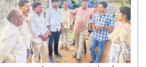
గ్రామంలో పర్యటిస్తున్న మిషన్ భగీరథ డీఈ