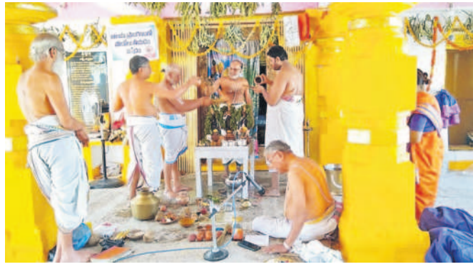
అలయాలో స్వామి వారికి అభిషేకం నిర్వహిస్తున్న అర్చకులు

కడపల్, మార్చి 12 : మండల పరిధిలోని చరికొండ గ్రామంలో వెలసిన రుక్మిణీసత్యం భవన సమేత వేణుగోపాలస్వామి ఆలయ ప్రారంభమయ్యాయి. ప్రత్యేక పూజలు ఆది బ్రహ్మోత్సవాల మంగళవారం భక్తిశ్రద్ధలతో ప్రారంభమయ్యాయి. బ్రహ్మోత్సవార్థం భక్తులు తొలిరోజు ఉదయం ఆలయానికి స్వామి వారికి అభిషేకం, అర్చనలు, హారతి, స్వస్తివాచకం, అంకురార్పణం, ప్రత్యేక పూజా కార్యక్రమాలు నిర్వహించారు. రుక్మిణీసత్యం భవన సమేత వేణుగోపాలస్వామి వారిని వివిధ రకాల పూలతో అందంగా అలంకరించారు. స్వామి వారిని భక్తులు ఆది క సంఖ్యలో దర్శించుకుని పూజలు నిర్వహించి మొక్కులు చెల్లించుకున్నారు. భక్తులు లకు ఎలాంటి ఇబ్బందులు కలుగుతుందా అని స్వామి వారికి అభిషేకం, అర్చనలు, హారతి, స్వస్తివాచకం, అంకురార్పణం, ప్రత్యేక పూజా కార్యక్రమాలు నిర్వహించారు.