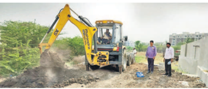
కాలువలో అక్షరామం వేసిన రోడ్డును తొలగిస్తున్న రెవెన్యూ అధికారులు