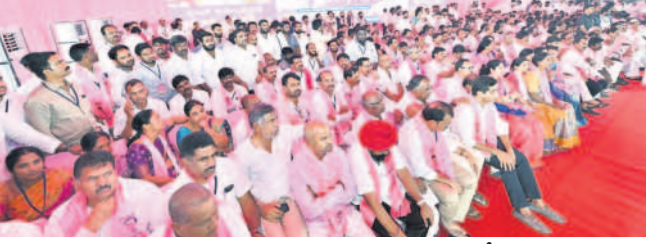
వేదికపై ప్రజాప్రతినిధులు, పాల్గొనే నాయకులు

కరీంనగర్ గడ్డపై నుంచి కడనభేరి మోగింది అధినేత కేసీఆర్, ఆద్యంతం తన ప్రసంగంతో ఆలోచించజేశారు. రాత్రి 7.05 గంటల నుంచి 7.40 గంటల వరకు ప్రసం