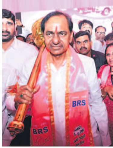
తెలంగాణ అనే మాటే అసెంబ్లీలో వినిపించ కూడదన కోరినట్లు కరీంనగర్ గడ్డ నాకు అండగా నిలబడింది. నాకున్న పదవులను విసిరి వాళ్ళ ముఖాన కొట్టిన, నిలబడాలి. కలబడాలి, సాంత రాష్ట్రాన్ని సాధించాలని నాతో పాటు పిడికెడు మనుషులతో ఇక్కడికి వచ్చి జై తెలంగాణ అని నినదించిన. - అధినేత కేసీఆర్