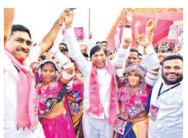
లంబాడీలతో కలిసి సృష్టించిన వినిోద్ కుమార్, జీవీఆర్