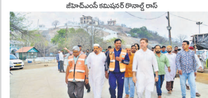
మౌలాళి గుట్టపై అభివృద్ధి పనులను పరిశీలిస్తున్న కమిషనర్ రోనాల్డ్ రాస్, విశ్రాంతి తదితరులు

సీటీబియూలో, మార్చి 12 (నమస్తె తెలంగాణ): మౌలాళి దర్గాలో భక్తుల సౌకర్యాలను చేపట్టిన వివిధ అభివృద్ధి పనులను వెంటనే పూర్తి చేయాలని కమిషనర్ రోనాల్డ్ రాస్ ఆధికారులను ఆదేశించారు.