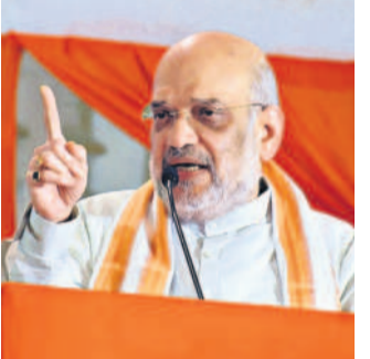
సమావేశంలో మాట్లాడుతున్న కేంద్ర హోం మంత్రి అమిత్ షా

కంటోన్మెంట్, మార్చి 12: తెలంగాణ అభివృద్ధి చెందాలంటే మోడల్ నే సాధ్యమని కేంద్ర హోం మంత్రి అమిత్ షా అన్నారు.