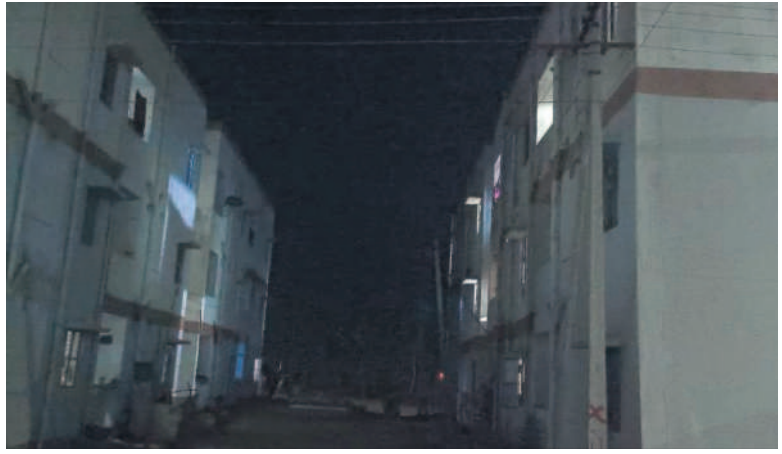
నీటి లైట్లు వెలుకపోవడంతో అధికారంలో ఇండ్లు

ఖానాపూర్, మార్చి 10 : నిర్మల్ జిల్లా ఖానాపూర్ పట్టణ శివారలోని కుప్రూ టీం చౌరస్తాలో కేసీఆర్ సర్కారు అన్ని హంగులతో 400 మంది నిలవేడవడం కంటే బెడ్రాం ఇండ్లను నిర్మించింది. 2023 సంవత్సరంలో అధికారులు సర్వే నిర్వహించి అర్హతైన అభిదారులకు పంపిణీ చేసింది. ఇందులో ఏ, టీ, టీ బ్లాకులను ఏర్పాటు చేయగా.. 17 అప్రెంటిస్ షిప్ కన్సాల్టం, ఒక్కో బిల్డింగ్ లో 24 కుటుంబాలు నివాసం ఉంటున్నాయి. కరెంట్ సరఫరా, తాగు నీటి వసతికి రెండు బోర్డును ఏర్పాటు చేసి పకల పనులను కల్పించింది.