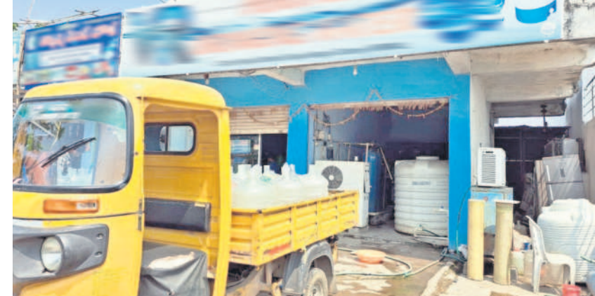
భైంసా రోడ్డులో నిబంధనలు పాటించకుండా నిర్వహిస్తున్న ప్లాంట్లు

నిర్మల్, మార్చి 10 (నమస్తే తెలంగాణ) : నిర్మల్ జిల్లాలో మినరల్ వాటర్ పేరిట జనరల్ వాటర్ విక్రయాలు జోరుగా సాగుతున్నాయి. అనుమతులు లేకుండా ప్లాంట్లను ఏర్పాటు చేస్తూ ప్రజల ఆరోగ్యంపై ప్రమాదం ఆడుతున్నారు. వేసవి రాగానే కాసులు కురిపించే వ్యాపారంలా మారింది. ముఖ్యంగా జిల్లాలోని నిర్మల్, భైంసా, ఖానాపూర్ పట్టణాలలో పాటు మండల కేంద్రాల్లో కూడా వాటర్ ప్లాంట్లు వెలుగుతున్నాయి. ఆయా ప్లాంట్లలో బోరు డ్రాస్ నీటిని సేకరించి సక్రమంగా శుద్ధి చేయకుండానే సురక్షిత జల మంటూ ప్రజలకు అందిస్తున్నారు. జనావాసాల్లో కూడా అనుమతులు లేకుండా ప్లాంట్లను ఏర్పాటు చేయడంతోపాటు పెద్ద ఎత్తున నీటిని సేకరించేందుకు రెండు, మూడు బోర్లు వేస్తున్నారు. దీంతో సమీపంలోని గృహాలకు చెందిన బోర్లలో నీరు అడుగుంటున్నది. కొన్ని చోట్ల 500 అడుగుల లోతు వరకు బోర్లు వేసినా నీళ్లు పడని పరిస్థితి. ఈ అక్రమంగా నిర్వహిస్తున్న ప్లాంట్లపై స్థానికులు ఫిర్యాదు చేసినా.. అధికారులు పట్టించుకోవడం లేదన్న ఆరోపణలు ఉన్నాయి. చిన్నచిన్న దుకాణాలు, హోటళ్లను పెట్టుకోవాలంటే మున్సిపాలిటీలు, పంచాయతీల నుంచి ట్రేడ్ లైసెన్స్ తీసుకోవాల్సి ఉంటుంది. కానీ.. పట్టణంలోని లోనుగులలు అలాగే కాలనీల దగ్గరూ ప్లాంట్లను నిర్వహిస్తున్నారు. అధికారులు కూడా మూసీ మాడనట్లు వ్యవహారంపై అసమానాలు వ్యక్తమవుతున్నాయి.