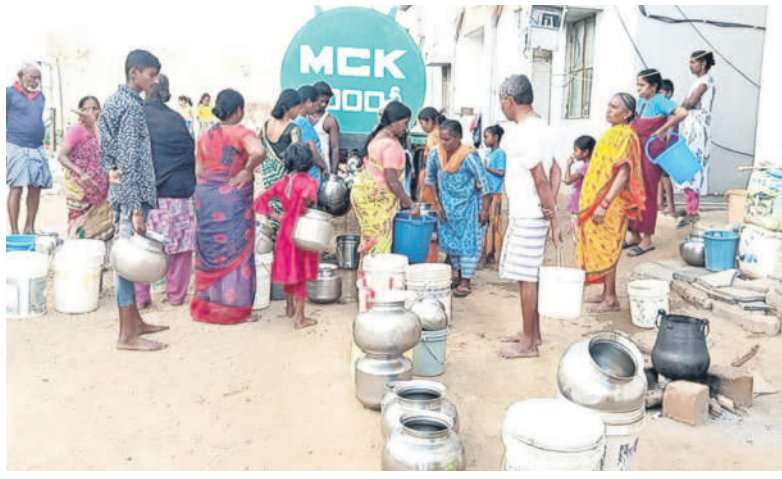
మంచి నీటి కోసం మున్సిపల్ ట్యాంకర్ వద్ద బాలులు తీరని ప్రజలు