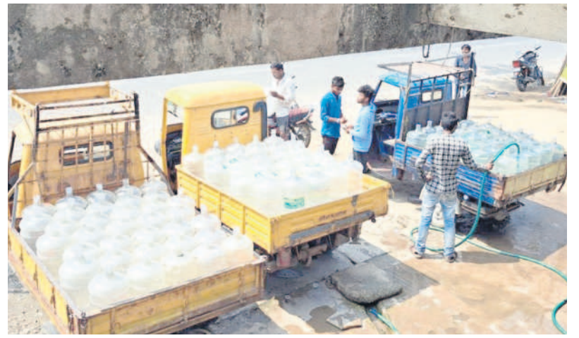
నిర్మల్ లోని ఓ మినరల్ వాటర్ ప్లాంట్ వద్ద క్యాంప్ లో నీటిని సంపుటన దృశ్యం

5 నిజామాబాద్, సోమవారం 11 మార్చి 2024 NIRMAL