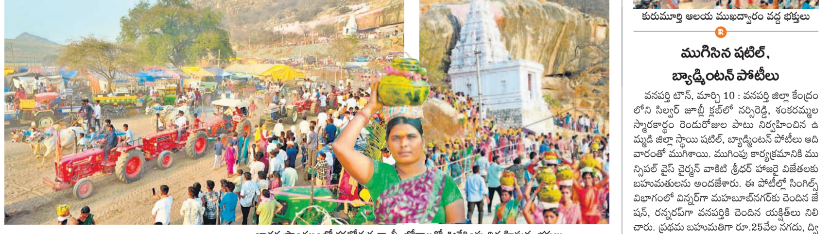
జాతర ప్రాంగణంలో శకటోత్సవ రథాల్లో భోవాలతో ఊరేగింపు నిర్వహిస్తున్న భక్తులు

నాగర్ కర్నూల్, మార్చి 10 : మండలంలోని కుమ్మర భ్రమరాంబ మల్లికార్జునస్వామి బ్రహ్మోత్సవాలు ఆదివారం ప్రారంభమయ్యాయి. ఉత్సవాల్లో భాగంగా బండ్లు, భోనాల ఊరేగింపు కార్యక్రమాలు నిర్వహించారు. ఉదయం మల్లికార్జున స్వామి విగ్రహాన్ని పునః ప్రతిష్ఠించారు. రాత్రి సమయంలో యాదవులు చేపట్టిన సాంస్కృతిక కార్యక్రమాలు ఆకట్టుకున్నాయి. ఆదివారం అమావాస్య కాండంతో ఉత్సవాలకు భక్తులు పెద్ద సంఖ్యలో తరలివచ్చారు. ఉత్సవాల్లో భాగంగా 11న ఉదయం 11 గంటలకు బిండి సేవ, 12న శివ పార్వతుల కల్యాణోత్సవం, 13న స్వామివారి ఊరేగింపు కార్యక్రమాలు నిర్వహించనున్నారు. భక్తులకు ఎలాంటి ఇబ్బందులు కలుగకుండా నిర్వాహకులు అన్ని ఏర్పాట్లు చేశారు.