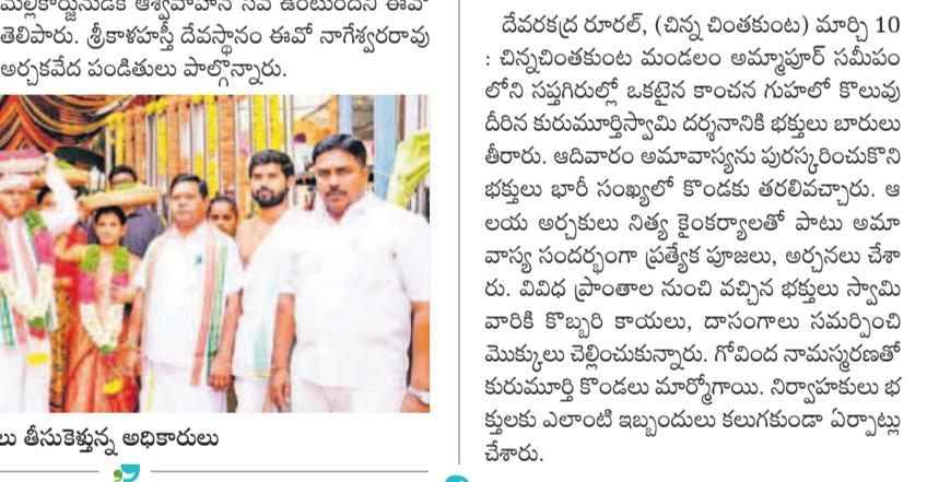
కురుమూర్తి స్వామి దర్శనానికి కూర్చో భక్తులు

దేవకల్వర రాజర్, (చిన్న చింతకుంట) మార్చి 10 : చిన్నచింతకుంట మండలం అమ్మపూర్ సమీపంలోని సప్తగుర్తి ఒడ్డున కాంచన గుహలో కొలువైన దీని కురుమూర్తిస్వామి దర్శనానికి భక్తులు బారులు తీరారు. ఆదివారం అమావాస్యను పురస్కరించుకొని భక్తులు భారీ సంఖ్యలో కొండకు తరలివచ్చారు. ఆలయ అర్చకులు నిత్య కైంకర్యాలతో పాటు అమావాస్య సందర్భంగా ప్రత్యేక పూజలు, అర్చనలు చేశారు. వివిధ ప్రాంతాల నుంచి వచ్చిన భక్తులు స్వామి వారికి కొబ్బరి కాయలు, దాసంగాలు సమర్పించి మొక్కులు చెల్లించుకున్నారు. గోవింద నామస్మరణతో కురుమూర్తి కొండలు మార్పొగాయి. నిర్వాహకులు భక్తులకు ఎలాంటి ఇబ్బందులు కలుగకుండా ఏర్పాట్లు చేశారు.