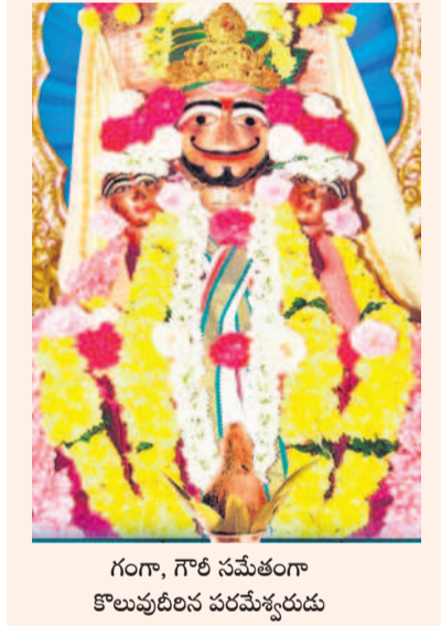
గంగా, గౌరీ సమేతంగా కొలువైన పరమేశ్వరుడు

చేరుకున్నది. ఆదరణ కరువవుతున్న నేపథ్యంలో గుడిని పట్టించుకునే దిక్కులేదు. వందల యేండ్ల కింటు నిర్మించిన ఆలయం నిత్యం చెరువులో ఉంటున్నా చెక్కు చెదదిన కళాఖండంగా నిర్మాణం జరిగింది. కేవలం బ్రహ్మోత్సవాలప్పుడు మాత్రమే ఆలయానికి సున్నాలు వేయడం, అంకంబడం జరుగుతుంది. తప్పా నిర్వహణ కష్టతరంగా మారింది. వంశ పార్యంపరంగా ఆర్థిక సేవలందిస్తున్న పూజారుల కుటుంబాలు పూట గడవడం కూడా గగనమైపోయింది. ప్రతియేటా మహాశివరాత్రి పర్వదినం పురస్కరించుకొని ఇక్కడ బ్రహ్మోత్సవాలు నిర్వహిస్తున్నాను. 1986ముందు వరకు ఆత్మకూరు వైభవంగా జరిగిన ఆత్మకూరు జాతర మహోత్సవం అప్పటి నుంచి అంతరించిపోయింది. దాదాపు పదేండ్లు పై బడి వచ్చిన కరువుతో జాతర వైభవాన్ని పూర్తిగా కోల్పోయింది. ప్రస్తుతం పాలక ప్రతినిధులు, దానాల సహకారంతోనే జాతర మహోత్సవం నిర్వహిస్తున్నామన్నారు. ఇదిలా ఉండగా ఆలయం శిథిలస్థితిలో వచ్చిన కరువుతో జాతర వైభవాన్ని పూర్తిగా కోల్పోయింది. ప్రస్తుతం పాలక ప్రతినిధులు, దానాల సహకారంతోనే జాతర మహోత్సవం నిర్వహిస్తున్నామన్నారు. ఇదిలా ఉండగా ఆలయం శిథిలస్థితిలో వచ్చిన కరువుతో జాతర వైభవాన్ని పూర్తిగా కోల్పోయింది. ప్రస్తుతం పాలక ప్రతినిధులు, దానాల సహకారంతోనే జాతర మహోత్సవం నిర్వహిస్తున్నామన్నారు. ఇదిలా ఉండగా ఆలయం శిథిలస్థితిలో వచ్చిన కరువుతో జాతర వైభవాన్ని పూర్తిగా కోల్పోయింది. ప్రస్తుతం పాలక ప్రతినిధులు, దానాల సహకారంతోనే జాతర మహోత్సవం నిర్వహిస్తున్నామన్నారు.