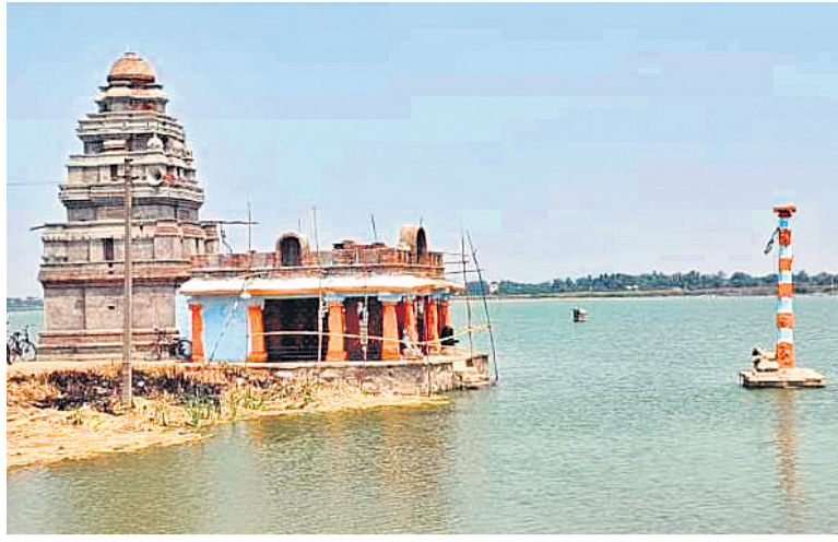
బ్రహ్మోత్సవాలకు సిద్ధమైన పరమేశ్వరస్వామి ఆలయం