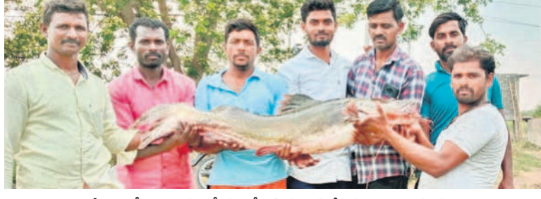
పప్పుల సమీపంలోని కృష్ణానదిలో వలలో చిక్కిన భారీ చేపను చూపుతున్న మత్స్యకారులు