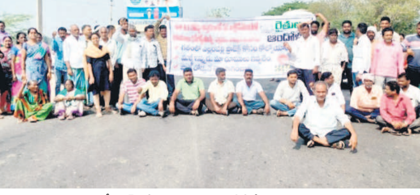
లక్షకొద్దీ జాతీయ రహదారిపై రాస్తారోకో చేస్తున్న ప్రజలు