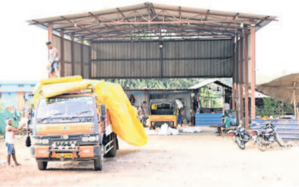
సిరోంచ గ్రామంలో నేషన్ రైస్ - 63 పక్కనే ఉన్న రేషన్ దండా వీరన్న స్థావరం (ఇక్కడే రేషన్ అధ్యయం లోడింగ్, అన్ లోడింగ్ జరుగుతుంది)

మంచిర్యాల, మార్చి 10 (సమస్య తెలంగాణ ప్రతినిధి) : వీరప్పన్ ఎవరో తెలుసు.. కానీ ఈ సిరోంచ వీరప్పన్ ఎవరనుకుంటున్నారా..? స్వగర్ల వీరప్పన్ లాగే.. ఇక్కడ రేషన్ దండాలో వీరన్న కూడా అంతే ఫీమస్. అటు మహారాష్ట్ర, ఇటు తెలంగాణ రాష్ట్రాల్లోని సగం జిల్లాలను శాశించే ఈ మాజీ యా డాన్ పేరు చెబితే వాలు అధికారులకు వణుకు పుడుతుంది. వ్యవస్థను చేతులో పెట్టుకొని ఆడించడంలో సిద్ధహస్తుడని అధికారులే చెబుతుండడం గమనార్హం. ఉన్నత స్థాయి అధికారులు మొదలు.. కిందిస్థాయి సిబ్బంది దాకా మామూలు ముఖజెప్పి పనులు చేయడం కోవడం.. కాదని బెట్టు చేస్తే చేయాల్సింది చేయడం ఆయన వెన్నతో పెట్టే విద్య అని అంటుంటారు.