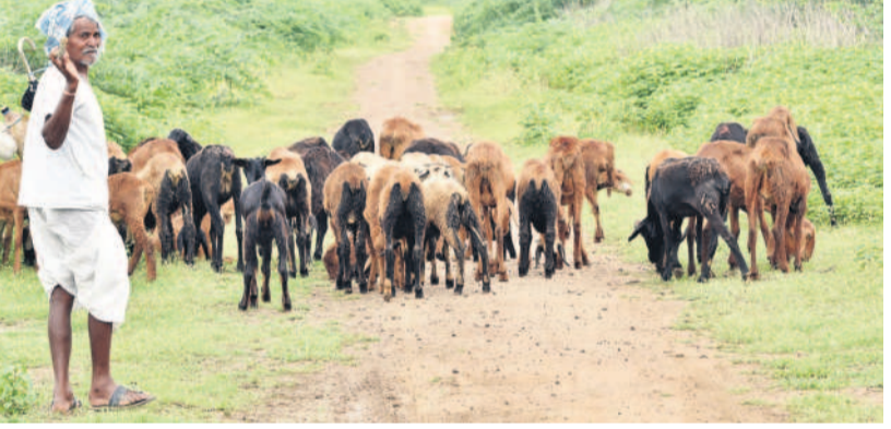
కేసీఆర్ ప్రభుత్వం పంపిణీ చేసిన గొర్రెలతో వ్యధుడు (ఫైల్)

విడుదలలో 2,891 మందికి యూనిట్లు అందించినది. ఆపై రెండో విడుదల ఏర్పాటు చేయగా, కరోనా కారణాల వల్ల జాప్యమైంది. దీంతో విడుదలలో 1,513 మందికి ఇప్పటి వరకు గొర్రెల యూనిట్లు అందలేదు. పథకం విలువ రూ.1.75 లక్షల కాగా, లబ్ధిదారులు రూ. 43,750 డిడీ రూపంలో చెల్లించాలి. మిగతా రూ.1,31,250లను ప్రభుత్వం సబ్సిడీ రూపంలో కలిపి గొర్రెలను అందించాలి. ఒక యూనిట్లో 21 గొర్రెలు కాగా, వీటిలో 20 గొర్రెలు, ఒక పాట్లెలు ఉంటుంది. రెండో విడుదల గొర్రెలు పంపిణీ అని విడిచి 562 మంది లబ్ధిదారులు రూ. 43,750 చొప్పున