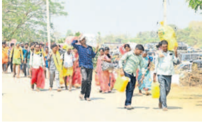
వేలాలనుంచి తిరిగి వెళ్ళుతున్న భక్తులు