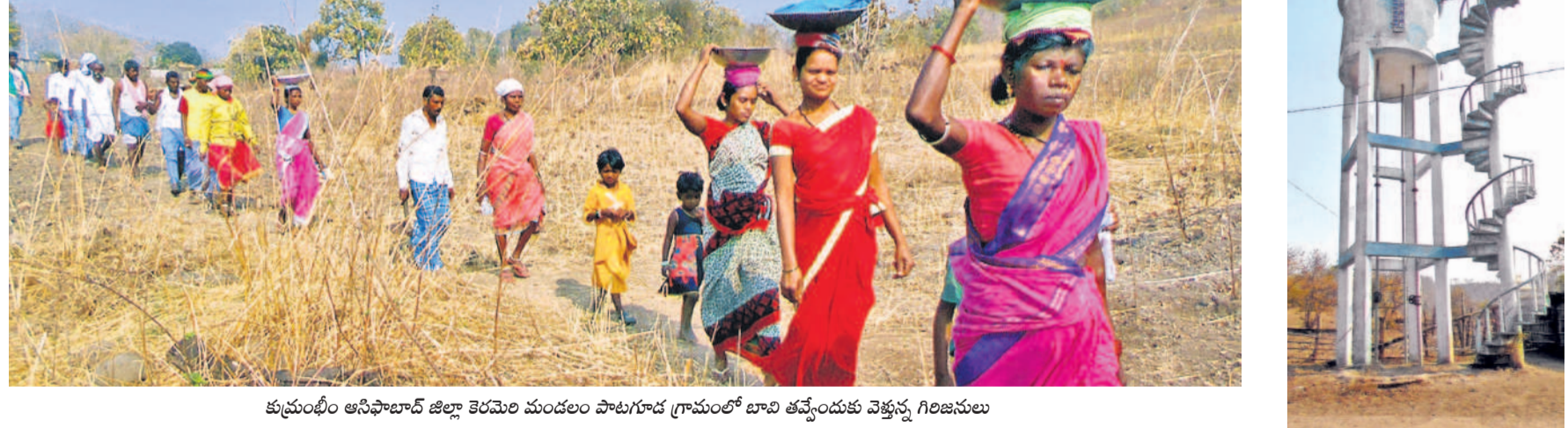
కుప్రంబీం ఆసిఫాబాద్ జిల్లా కెరమెరి మండలం పాటగూడ గ్రామంలో బావి తవ్వించుకు వెళ్తున్న గిరిజనులు