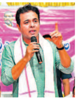
రేవంత్ కు విజ్ఞప్తి ఉంటే వెంటనే మేడిగడ్డను రిపేర్ చేసి పంటలకు నీళ్లు వ్యాపి. డిసెంబర్ 8న కేసీఆర్ సీఎం అయ్యారంటే దేశంలోని కాంగ్రెస్ కార్యకర్తలందరూ మేడిగడ్డను బాగు చేయించి ఉమ్మడి జిల్లాలోని 18 మండలాలకు సాగు, తాగునీరుందించేవారు. - కేటీఆర్

కాంగ్రెస్ తెచ్చిన కరువు కాలం తెచ్చిన కరువు కాదు కరెంటు కష్టాలు, ఎరువుల గోస, తాగునీటికి తండ్లాట సీఎం రేవంత్ క ప్రభుత్వాన్ని నడవటం చేతనైతేలేదు మనం ప్రశ్నించకపోతే ప్రజల్ని బదిండ్లు మోసం చేస్తురు పార్లమెంట్ లో ప్రశ్నించే గొంతుగా బీఆర్ఎస్ గెలవాలి 12న జరిగే బీఆర్ఎస్ కదనభేరిని విజయవంతం చేయాలి తెలంగాణ గళం, బలం కేసీఆర్.. కార్యకర్తలతో కేటీఆర్