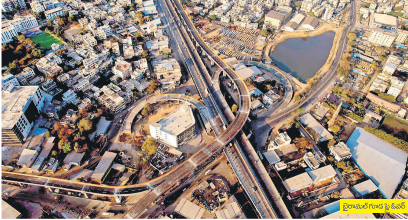
బైరామల్ గూడ ఫైవ్ లైన్

మహానగరంలో.. మరో వంతెన • ప్రజలకు అందుబాటులోకి వస్తున్న కేసీఆర్ ప్రభుత్వ పూర్వోత్తక పుగలి • హార్వం వ్యక్తం చేస్తున్న గ్రేటర్ వాసులు