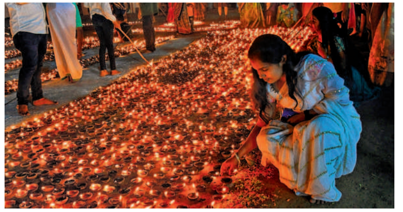
శుక్రవారం రాత్రి సికింద్రాబాద్లోని జవహర్ లాల్ నెహ్రూ రామాలయంలో లక్ష పిపిలను వెలిగిస్తున్న భక్తులు