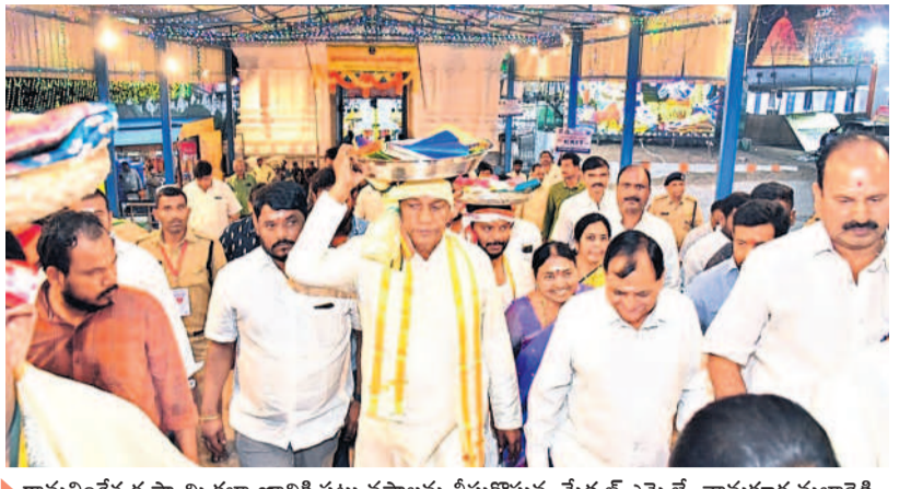
రామలింగేశ్వర స్వామి కల్యాణానికి పట్ట పస్ట్రాలును తీసుకొస్తున్న మేడ్చల్ ఎమ్మెల్యే చామకూర మల్లాద్రి

సిటీబ్యూరో ప్రధాన ప్రతినిధి, మార్చి 8 (నమస్తే తెలంగాణ) : ఒక వ్యక్తి మురుగులోకి దిగి మరో వ్యక్తి శుభ్రం చేయడమంటే అది అనాగరికం! మరి.. విశ్వ నగరం అని కీర్తిం చుకుంటున్న హైదరాబాద్ మహా నగరం నడిబొడ్డున నాగరిక ప్రపంచంలో ఈ అనాగరిక దృశ్యం అందరినీ కలిపివేసింది. రెండు రోజుల కిందట నగరంలోని గోల్కొండ ప్రాంతంలో మ్యాన్ హోల్లోకి దిగి కూలీలు డ్రైనేజీని శుభ్రం చేస్తూ కనిపించిన దృశ్యమిది. బాధ్యత కలిగిన ఒక పౌరుడు స్పందించి ఫోటోలు తీసి 'నమస్తే తెలంగాణ'కు అందించారు. జీహెచ్ఎంసీ అధికారులు ఈ కూలీలకు రోజుకు రూ.1100 (జంటకు... మగవారికి రూ.800, ఆడవారికి రూ.500) ఇచ్చి శుభ్రం చేయిస్తున్నారు. వాస్తవానికి ఇది వాన నీటి ప్రవాహం కోసం నిర్మించిన ఫైవ్ లైన్ (రెయిన్ వాటర్ ఫైవ్ లైన్). ఇందులో కేవలం వర్షపు నీళ్లు మాత్రమే పారాలి. కానీ అందుకు విరుద్ధంగా అధికారులు మురుగు నీటిని (డ్రైనేజీ లైన్) అనుసంధానం చేశారు. అందుకే మ్యాన్ హోల్లను శుభ్రం చేస్తున్న సమయంలో అటుగా వెళ్లి పాదాచారులు దుర్గంధంతో ముక్క మూసకొని వెళ్లారు. అయితే ఈ రవాదారిలో ఆసలు మురుగునీటి వ్యవస్థ ఎందుకు లేదు? వాన నీటి కోసం నిర్మించిన వ్యవస్థలో మురుగునీరు ఎందుకు వస్తుంది? జలంపంజరి మురుగునీటి వ్యవస్థను నిర్వహిస్తుండగా.. ఇక్కడ ఆ బాధ్యతను జీహెచ్ఎంసీ ఎందుకు చేపడుతుంది? ఇవన్నీ సందేహాలు ఒక ఎత్తయితే... కొట్లాడి రూపాయలు వెచ్చించి నగరంలో ఎయిర్ బెక్ యంత్రాలను కొనుగోలు చేయడం, అద్దెకు తీసుకుంటున్న ప్రభుత్వ విభాగాలు.. ఆసలు మురుగునీటి పరిష్కార వ్యవస్థలో శుభ్రం చేయించడం సభ్య సమాజానికి సిగ్గు చేటు! ఇక్కడ ఇంకో విషయం... కొన్నిరోజుల కిందటి జియోగ్రాఫర్ ఓ డ్రైనేజీ లైన్ అనుసంధానం కోసం మ్యాన్ హోల్లోకి దిగిన ముగ్గురు కూలీలు మృత్యువాత పడిన ఘోరకలి మరణి మేదులతం డగానే ఈ దృశ్యాలు కనిపించాయి.