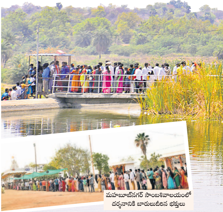
మహాబూబ్ నగర్ సాంబశివాలయంలో దర్శనానికి బారులుదీరిన భక్తులు

కొల్హాపూర్, మార్చి 8 : భక్తుల శివనామస్మరణతో సోమశిల క్షేత్రం పులకించిపోయింది. శివ శివ శంకరా.. భక్తవంశకరా.. శంభో హరహర నమోనమో.. అంటూ లలితా సోమేశ్వరస్వామి అలయంలో మార్గోగింది. సోమేశ్వరాలయంలో రుద్రాభిషేకాలు, కుంభమార్చనలు, అలంకరణ, లలితాదేవికి ప్రత్యేక పూజలు చేశారు. కొల్హాపూర్ నుంచి ప్రత్యేక బస్సులను నడిపించారు. మహిళలు పెద్దపత్తుల సోమశిలకు తరలిరాగా.. అలయ ప్రాంగణం కిటికీ బలాడింది. సప్తనదిలో కృష్ణ, వేణి, తుంగ, భద్ర, మలవలసాణి, భీమావతి, భవనానీ కొందరు పుణ్యస్నానాలు ఆచరించారు. కొందరు మహిళాకుటుంబాల్లో గంగాదేవి ప్రతిమలను తయారుచేసి పూ