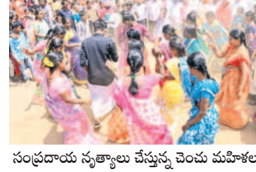
సంప్రదాయ నృత్యాల చేస్తున్న చెంచు మహిళలు