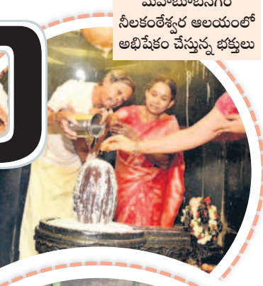
మహాబూబ్ నగర్ నీలకంఠేశ్వర అలయంలో అభిషేకం చేస్తున్న భక్తులు