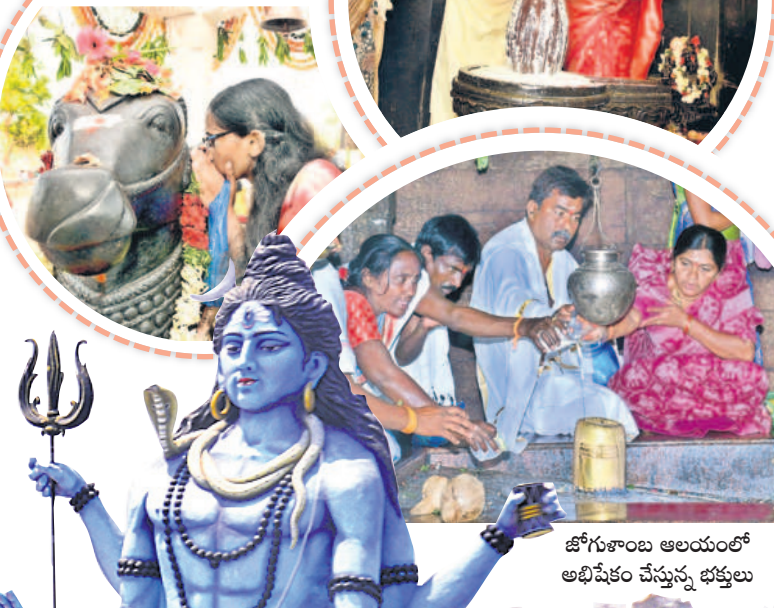
జోగులాంబ అలయంలో అభిషేకం చేస్తున్న భక్తులు