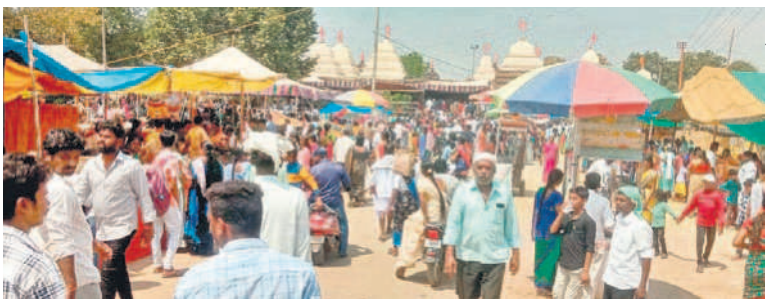
లలితాసోమేశ్వరస్వామి అలయ ప్రాంగణంలో భక్తుల రద్దీ