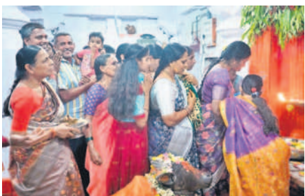
నారాయణపేట జిల్లా కేంద్రంలోని శివాలయంలో పూజలు చేస్తున్న భక్తులు