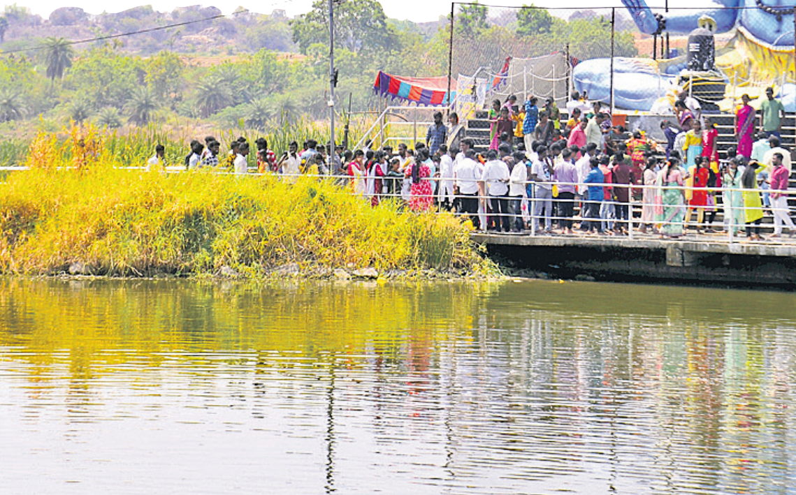
కోక్తకోట మండలంలోని పామాపురం అలయం వద్ద ఉన్న శివప్రతిమను దర్శించుకుంటున్న భక్తులు