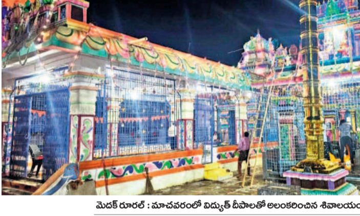
మెడక్ రూర్లో: మావవరంలో విద్యుత్ దీపాలతో అందరిందిన శివాలయం