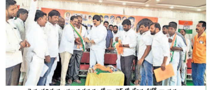
మైంపల్లి పాస్టోరల్ గ్రూపులోని కాంగ్రెస్ లోకి చేగుంట బీజేపీ నాయకులు