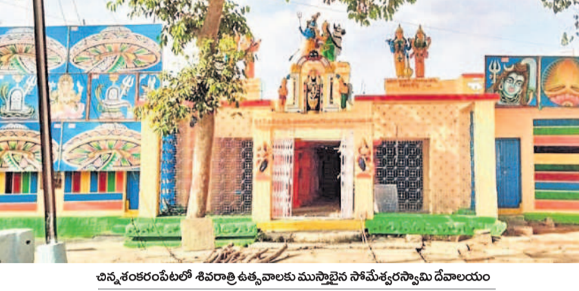
చిన్నకంకరంపేటలో శివరాత్రి ఉత్సవాలకు ముస్తాబైన సోమేశ్వరస్వామి దేవాలయం