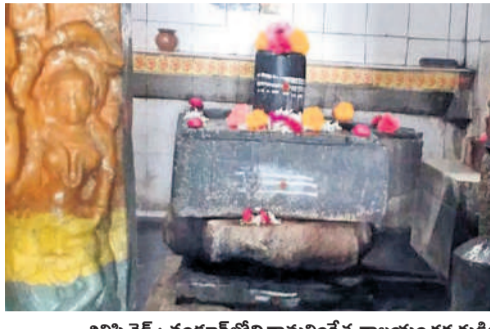
చిలిపిచెడ: చందూరులోని రామలింగేశ్వరాలయం గర్భగుడిలోని శివలింగం