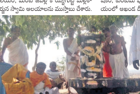
పెద్దకంకరంపేట: గొట్టిముక్కల రాజులగుట్టలో శివలింగానికి పూజలు చేస్తున్న గ్రామస్థులు

మెడక్ మండలంలో.. మెడక్ మండలంలోని శైవ కేంద్రాలన్నీ ఉత్సవాలకు ముస్తాబు అవుతున్నాయి. మావవరం శివాలయం, మంబోజిపల్లి కొయ్యగుట్ట మల్లికార్జున స్వామి ఆలయాలు ముస్తాబు చేశారు.