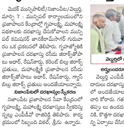
వెల్దుర్తిలో దరఖాస్తులు స్వీకరణ