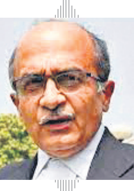
- ప్రతాప్ భూషణ్, ప్రఖ్యాత న్యాయవాది

ఎన్నికల బాండ్ల దేబాసు లాడే గినప్పయి ఎన్టీఆర్ నుండి కోట్ల మొదలు గిరసవదినట్లు ప్రవర్తించింది. అదే కేంద్రం లాడే గిత్ చురుగ్గా స్పందిస్తుంది. రాజకీయ పార్టీలకు రహస్యంగా విరాళాలు ఇచ్చినవారి పేర్లను వెల్లడించమని కోట్ల అడిగితే అది చాలా త్వరమే కూడన పని ఎన్టీఆర్ అంటుంది. కానీ కేంద్రం వట్ల మాత్రం ఎన్టీఆర్ ఉత్సాహం, విధేయత చూపుతుంది.