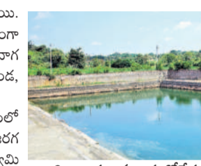
శివాలయం ముందు కోనేరు

బ్రహ్మోత్సవాలకు ఏర్పాటు పూర్తి.. శివాలయంలో నిర్వహించే మహా శివరాత్రి బ్రహ్మోత్సవాలకు అన్ని రకాల ఏర్పాట్లు పూర్తయ్యాయి. వివిధ ప్రాంతాల నుంచి వచ్చే భక్తుల సౌకర్యార్థం ఆలయ ఆవరణలో తాగునీటి, వసతి తదితర సదుపాయాలు కల్పించారు. మూడు రోజులపాటు వైభవంగా జరిగే బ్రహ్మోత్సవాల్లో భక్తులు అధిక సంఖ్యలో పాల్గొనాలి. - స్వీహాలత్, ఆలయ ఈవో, మైసూర్ మైసమ్మ తల్లి, శివాలయం, రామాలయం