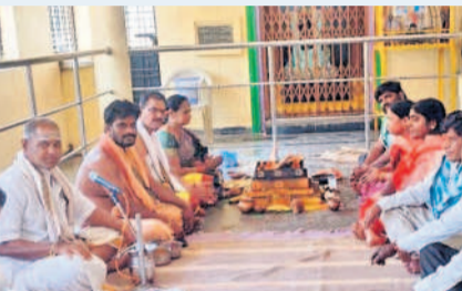
అయ్యసాగర్ లోని ఆలయంలో యజ్ఞం చేస్తున్న నిర్వాహకులు, భక్తులు