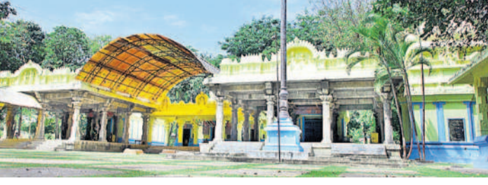
శివాలయం ముందు కోనేరు