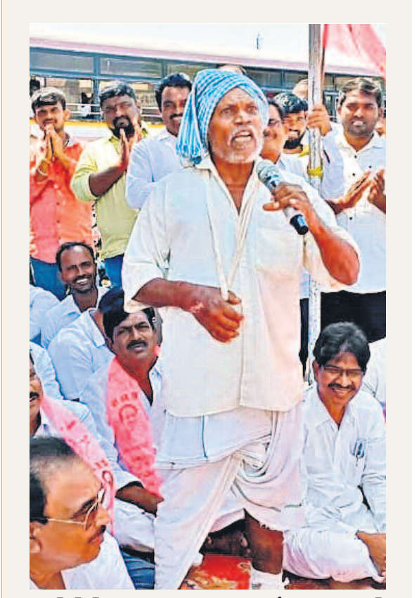
ఎల్ఆర్ఎస్పై ప్రభుత్వ మోసాన్ని నిరసిస్తూ దేవరకొండ బస్టాండ్ ఆవరణలో బుధవారం బీఆర్ఎస్ అధ్యక్షులలో నిర్వహించిన ధర్నాలో మాట్లాడుతున్న రైతు సంగం వర్కతాలు

బోళ్లు కడగాడ్లు.. స్నానం చేయొద్దు బెంగళూరులో నీటి వినియోగంపై కాంగ్రెస్ సర్కార్ సూచన > 7