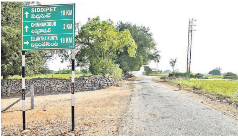
సిద్దిపేట జిల్లాలోని చిన్నాకూరు నుంచి ఇల్లంతకుంటకు వెళ్లే రహదారి