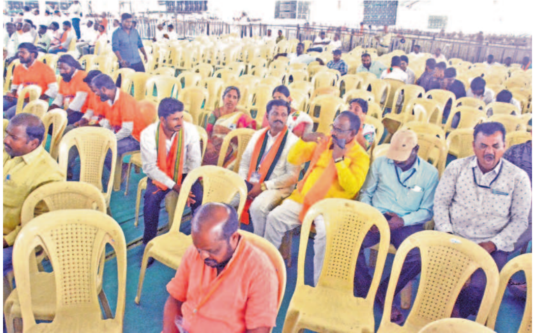
ప్రధాని మోడి సభలో ఖాళీగా దర్శనమిస్తున్న కుర్చీలు