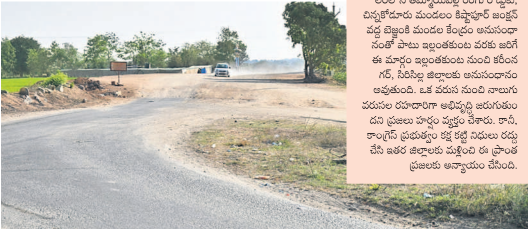
ఇల్లంతకుంటకు వెళ్లే రహదారి