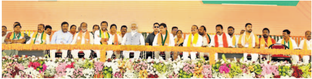
సభా వేదికపై ప్రధాని సరేంద్రమోడి, బీజేపీ ఎంపీ, ఎమ్మెల్యేలు తదితరులు

జనసమీకరణలో బీజేపీ నేతల విఫలం అడుగుడునా తనిఖీలతో ప్రజలు బేజారు ప్రధాని ప్రసంగంలో అభివృద్ధి ప్రస్తావన.. జోష్ నింపిన స్పీచ్ రామమందిరం ప్రస్తావనతో మార్చి 15న జైరీరాం నినాదాలు