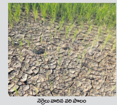
నెల్లెలు వాటిన వరి పాలం