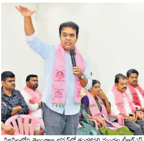
సిరిసిల్ల జిల్లా మున్సిపాలిటీలో నిర్వహించిన పార్టీ కార్యక్రమ సమావేశంలో పాల్గొన్న నాయకులు, కార్యకర్తలు