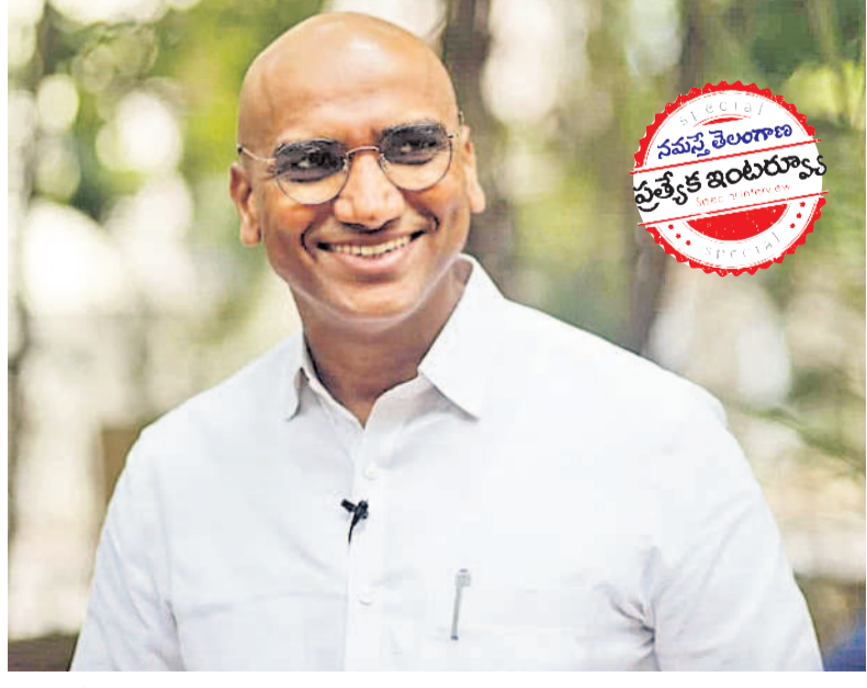
బహుజన పరిశోధన న్యాయం జరగాలి

తెలంగాణను కాంగ్రెస్, బీజేపీ నుంచి రక్షించాలి. రాష్ట్రంలో కొట్ల మంచి బహుజన ప్రయోజనాలు ప్రమాదంలో ఉన్నాయి. రాజ్యాంగం రద్దు అయ్యే ప్రమాదం ఉన్నది. విచ్చిన్నకరమైన పరిస్థితి ఉన్నది. బహుజన పరిశోధన న్యాయం జరగాలనేది మా