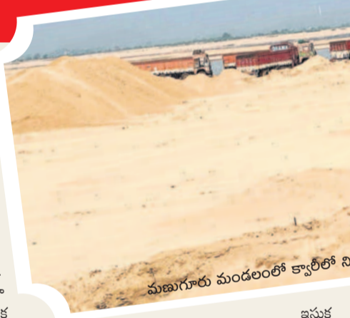
మణుగూరు మండలంలో కార్గిలో నిల్వ ఇసుక

ఇసుక రేటు బాగా పెరిగిపోయే సరికి భవన నిర్మాణాలకు భారం పెరిగింది. గతంలో ట్రాక్టర్ ఇసుక రూ.2వేలు ఉంటే ఇప్పుడు రూ.8వేల వరకు పలుకుతున్నది. ఇసుక లేకుండా నిర్మాణాలు జరగవు కాబట్టి ఇసుక మీరు తెచ్చుకోండి.. మేము గతంలో ఉన్న రేటుకు కట్టిపెడతాం అంటున్నారు కాంగ్రెస్ కృష్ణ. దీంతో ఇంటి యజమానులు చేసిదేమీలేక మేస్త్రీలు అడిగిన రేటు ఇచ్చి నిర్మాణాలను సాగిస్తున్నారు.