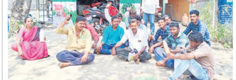
ములకలపల్లిలోని విత్తన దుకాణం ఎదుట ధర్నా చేస్తున్న రైతులు

నకిలీ విత్తనాలు అంటగట్టారని పురుగుమందు డబ్బాలతో బైరాయింపు