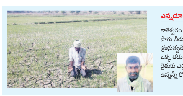
ఎన్నడూ గుంట కూడా ఎండలే

పెద్దపల్లి, మార్చి 4 (నమస్తే తెలంగాణ) : తెలంగాణ రాజకీయ మండలి నియోజకవర్గంలో సాగునీటి సమస్య తీవ్రంగా ఉండేది. ఎస్సారెస్సీ చివరి ఆయకట్టు భూములకు నీరందకపోయేది. ఏటా యాసంగిలో పంటలు ఎండిపోయే పరిస్థితి ఉండగా, రైతులు ఆగమం చెప్పి ఇలాంటి కరువు పరిస్థితులను దూరం చేసే ఉద్దేశంతో అప్పటి కాంగ్రెస్ ప్రభుత్వం ఎల్లంపల్లి ప్రాజెక్టు నుంచి గుండారం రిజర్వాయర్లకు ఫైవర్ల వేసింది. దీని ద్వారా ఎల్లంపల్లి నుంచి 2.84 ఏకరల నీటిని లింక్ కెనాల్ ద్వారా, జేగంపేట, శుక్రవారంపేట రిజర్వాయర్లను నింపుకొని, కమాన్వెల్త్, ముత్తూరం, మండలి ప్రాంతాల్లోని ఎస్సారెస్సీ చివరి ఆయకట్టుకు ఇవ్వాలని భావించింది. అయితే ఏటా మార్చి తర్వాత ఎల్లంపల్లి ప్రాజెక్టులో తగినంత నీటి లభ్యత లేక నీళ్లు వచ్చే పరిస్థితి ఉండేది కాదు. దాంతో పంటలు చేతికొచ్చే దశలో ఎండిపోయేవి. పెట్టిన పెట్టుబడులు ఎక్కడ రైతులకు అప్పులే దిక్కు చెల్లాయి. ఒక దశలో అభ్యుదయ పార్టీని ఏర్పాటు చేసి, కానీ, కేసీఆర్ సర్కారు అధికారంలోకి వచ్చిన తర్వాత కాళేశ్వరం ప్రాజెక్టును నిర్మించడంతో పరిస్థితి మారింది. మేడిగడ్డ నుంచి ఎగువ బ్యాంజిల్లోకి గోదావరి జలాలను ఎత్తిపోయడంతో ఎల్లంపల్లి ఎప్పుడూ నిండుగా ఉండేది. దాంతో మండలి నియోజకవర్గంలోని ఎస్సారెస్సీ చివరి ఆయకట్టు వరకూ సమృద్ధిగా నీరుందింది. గతేడాది మార్చిలో పాదస్థితి సంవహారం ద్వారా ఎల్లంపల్లిలోకి నీటిని ఎత్తిపోసుకోవడంతో సాగునీటి సమస్య లేకుండా పోయింది. అప్పుడు ఎల్లంపల్లిలో