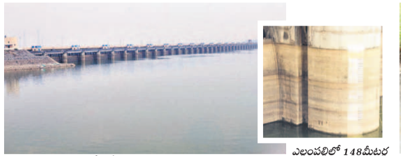
అంతర్గత మండలంలోని శ్రీపాద ఎల్లంపల్లి ప్రాజెక్టు

రాజన్న సిరిసిల్ల, మార్చి 4 (నమస్తే తెలంగాణ) : పార్లమెంట్ ఎన్నికల సన్నాహక సమావేశాల్లో భాగంగా బీఆర్ఎస్ పార్టీ మంగళవారం ముస్తాబాద్, సిరిసిల్లలో కార్యక్రమ విస్తృత స్థాయి సమావేశాలు నిర్వహించనున్నారు. పార్టీ వర్కింగ్ ప్రెసిడెంట్, సిరిసిల్ల ఎమ్మెల్యే కేటీఆర్ ముఖ్య అతిథిగా హాజరు కానున్నారు. మంగళవారం ఉదయం 11 గంటలకు ముస్తాబాద్లోని ఎంఎం గార్డెన్లో మండల పార్టీ కార్యకర్తల సమావేశం, మధ్యాహ్నం ఒంటి గంటకు సిరిసిల్లలోని రంగడు వద్ద ఉన్న తెలంగాణ భవన్లో తంగళ్లపల్లి మండల కార్యకర్తల సమావేశం ఉంటుందిని పార్టీ నాయకులు తెలిపారు. పార్లమెంట్ ఎన్నికల్లో అనుసరించాల్సిన వ్యూహంపై కార్యకర్తలకు కేటీఆర్ దిశానిర్దేశం చేయనుండగా, ముస్తాబాద్, సిరిసిల్లలో భారీ ఏర్పాట్లు చేశారు.