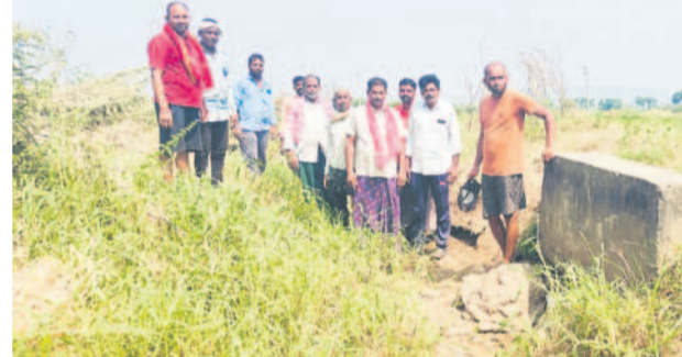
ఎండిపోయిన కాలువను చూపిస్తున్న కాకర్లపల్లి రైతులు

కాళేశ్వరం ఎత్తిపోతల పథకం మొన్నటిదాకా బీడుభూములకు ప్రాణం పోసింది. మండలి నియోజకవర్గంలో ఎస్సారెస్సీ చివరి ఆయకట్టుకు జీవధారమైంది. శ్రీరాంసాగర్ నుంచి నీళ్లకే వరిపండి లేకున్నా.. ఎల్లంపల్లి నుంచి లింక్ కెనాల్ ద్వారా నీరు ఇప్పుడంతో సాగు పండుగలా సాగింది. ఎల్లంపల్లిలోనూ నీటి లభ్యత తేలి సమయంలో దిగువ నుంచి ఎత్తిపోసి నింపడంతో ఏనాడూ ఇబ్బంది కాలేదు. కానీ, ప్రస్తుతం సాగు ప్రశ్నార్థకంగా మారింది. శ్రీరాంసాగర్, ఎల్లంపల్లి ప్రాజెక్టుల్లో నీటిమట్టం తగ్గడం, కాళేశ్వరం నుంచి ఎత్తిపోసి పరిస్థితి లేకపోవడం శాపంలా పరిణమిస్తున్నది. సాగునీరు లేక దాదాపు వేల ఎకరాల్లో పంటలు ఎండిపోతుండగా, రైతులు అందోళ్ల వ్యర్థం చేస్తున్నారు. నెలెలు వారుతున్న పొలాలను మాసి కన్నీరు పెడుతున్నారు. గత కేసీఆర్ ప్రభుత్వంలో ఏనాడూ ఇలాంటి దుస్థితి రాలేదని గుర్తు చేస్తున్నారు. సాగు నీరందించడంలో ప్రస్తుత ప్రభుత్వం విఫలమైందంటూ ఆరోపిస్తున్నారు.