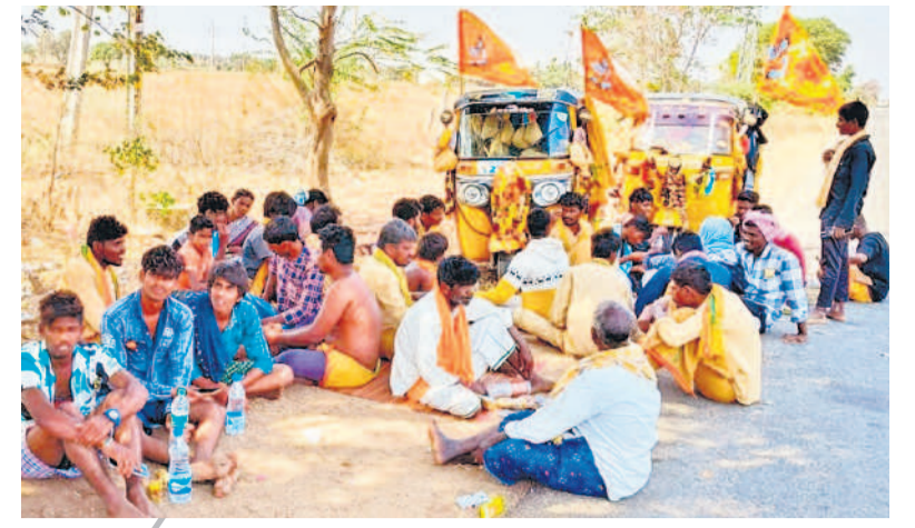
శ్రీశైలం వెళ్లే దారిలో విశ్రాంతి తీసుకుంటున్న స్వామిలు