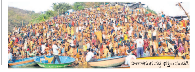
పాతాళగంగ వద్ద భక్తుల సందడి