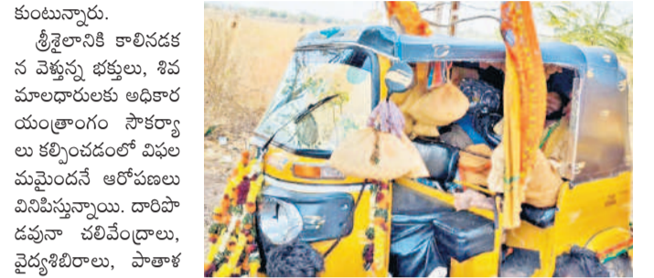
అటోలో ఇరుముడులను ఉంచిన స్వామిలు

కుంటున్నారు. శ్రీశైలానికి కాలినడకన వెళ్తున్న భక్తులు, శివమాలధారులకు అధికార యంత్రాంగం సౌకర్యాల కల్పించడంలో విఫలమైందనే ఆరోపణలు వినిపిస్తున్నాయి. దారిపొడవునా చలివేంద్రాలు, వైద్యశిబిరాలు, పాతాళ గంగ వద్ద స్వామిలను రించే భక్తుల కోసం తాత్కాలిక మూత్రశాలలు, బట్టలు మార్చుకునేందుకు తాత్కాలిక గదులు, నీడ తీయకుండా విశ్రాంతి కేంద్రాలను ఏర్పాటు చేయాలి. సంబంధిత శాఖల అధికారులు సమావేశమై ఏర్పాట్లపై చర్చించాలి. మున్నూరు, పలువర్ష పల్లి, డోమలపేట, పాతాళగంగ ప్రాంతాల్లో వైద్యశిబిరాలు, చలివేంద్రాలు, విశ్రాంతి కేంద్రాలు ఏర్పాటు చేయాలి. శివరాత్రికి మూడు రోజుల సమయమే ఉండగా నేటికే ప్రభుత్వవారి అలాంటి చర్యలు చేపట్టలేదు. కాగా, శివస్వామిలు, భక్తులకు స్వచ్ఛంద సంస్థలు అండగా నిలుస్తున్నాయి. పెట్రోలింగ్ బృందాల ద్వారా మున్నూరు నుంచి డోమలపేట వరకు అటవీ మాఫియా కాలినడకన వెళ్తున్న శివస్వామిలకు కార్చిచ్చు, ప్లాస్టిక్ నివారణ కోసం అవగాహన కల్పించేందుకు మూడు పెట్రోలింగ్ బృందాలను ఏర్పాటు చేశారు. దారిపొడవునా పెట్రోలింగ్ నిర్వహిస్తూ మంటలు పెట్టే వంటలు చేయకుండా, ప్లాస్టిక్ కవర్లు ఉపయోగించకుండా అవగాహన కల్పిస్తున్నారు. అటవీశాఖ అధ్యక్షులతో మూడు చలివేంద్రాలు ఏర్పాటు చేసినట్లు మున్నూరు ఎస్ఐ ఆర్. వి. శశ్వత్ తిలిపాడు. ఇప్పటికే కార్చిచ్చు కారణంగా వేల హెక్టార్లలో అడవి దగ్గరైన కారణంగా అడవిలో పొయ్యిపెట్టి వంట చేయొద్దని హెచ్చరించు సూచిస్తున్నారు.