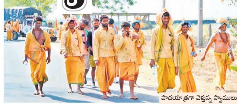
పాదయాత్రగా వెళ్తున్న స్వామిలు

కుంటున్నారు. శ్రీశైలానికి కాలినడకన వెళ్తున్న భక్తులు, శివమాలధారులకు అధికార యంత్రాంగం సౌకర్యాల కల్పించడంలో విఫలమైందనే ఆరోపణలు వినిపిస్తున్నాయి. దారిపొడవునా చలివేంద్రాలు, వైద్యశిబిరాలు, పాతాళ గంగ వద్ద స్వామిలను రించే భక్తుల కోసం తాత్కాలిక మూత్రశాలలు, బట్టలు మార్చుకునేందుకు తాత్కాలిక గదులు, నీడ తీయకుండా విశ్రాంతి కేంద్రాలను ఏర్పాటు చేయాలి. సంబంధిత శాఖల అధికారులు సమావేశమై ఏర్పాట్లపై చర్చించాలి. మున్నూరు, పలువర్ష పల్లి, డోమలపేట, పాతాళగంగ ప్రాంతాల్లో వైద్యశిబిరాలు, చలివేంద్రాలు, విశ్రాంతి కేంద్రాలు ఏర్పాటు చేయాలి. శివరాత్రికి మూడు రోజుల సమయమే ఉండగా నేటికే ప్రభుత్వవారి అలాంటి చర్యలు చేపట్టలేదు. కాగా, శివస్వామిలు, భక్తులకు స్వచ్ఛంద సంస్థలు అండగా నిలుస్తున్నాయి. పెట్రోలింగ్ బృందాల ద్వారా మున్నూరు నుంచి డోమలపేట వరకు అటవీ మాఫియా కాలినడకన వెళ్తున్న శివస్వామిలకు కార్చిచ్చు, ప్లాస్టిక్ నివారణ కోసం అవగాహన కల్పించేందుకు మూడు పెట్రోలింగ్ బృందాలను ఏర్పాటు చేశారు. దారిపొడవునా పెట్రోలింగ్ నిర్వహిస్తూ మంటలు పెట్టే వంటలు చేయకుండా, ప్లాస్టిక్ కవర్లు ఉపయోగించకుండా అవగాహన కల్పిస్తున్నారు. అటవీశాఖ అధ్యక్షులతో మూడు చలివేంద్రాలు ఏర్పాటు చేసినట్లు మున్నూరు ఎస్ఐ ఆర్. వి. శశ్వత్ తిలిపాడు. ఇప్పటికే కార్చిచ్చు కారణంగా వేల హెక్టార్లలో అడవి దగ్గరైన కారణంగా అడవిలో పొయ్యిపెట్టి వంట చేయొద్దని హెచ్చరించు సూచిస్తున్నారు.