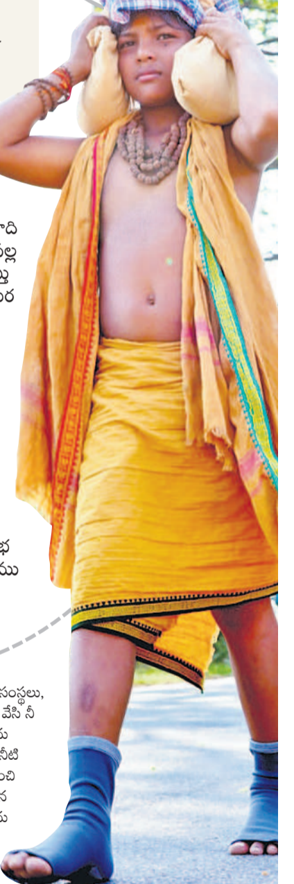
సంస్థలు, వ్యాపారులు రోడ్లు, శివారు ప్రాంతాల్లో బెంట్లు వేసి నీడ, నీళ్ళను అందిస్తున్నారు. విడివిడి కోసం బెంట్లను ఏర్పాటు చేశారు. అన్నదానాలు, ఫలహారాలు, నీటి పనెంతోపాటు రెస్ట్ తీసుకునేలా వసతులు కల్పించి వారి సేవలో తలవిప్పుతున్నారు. అనారోగ్యం గురైన వారికి మందులు అందిస్తూ స్వామిలపై ప్రేమను చాటుతుంటున్నారు. స్వామిల యాత్రలో నల్లమలలో ఆధ్యాత్మిక శోభ నెలకొన్నది.

అభయారణ్యం ఏర్పాటు చేయాలి. అభయారణ్యంలో జాగ్రత్తలపై అవగాహన కల్పిస్తున్నారు. అభయారణ్యంలో చిరుతలు, ఎడ్లవులుల కడలికల్లు జాగ్రత్తగా ఉండాలని సూచిస్తున్నారు. రోడ్లపై ఎడ్లవుల నడవడం, రోడ్లపై విశ్రాంతి తీసుకోవడం, అడవిలో మంటలు పెట్టారని, ప్లాస్టిక్ సామగ్రి ఎక్కడ చదితే అక్కడ వేయొద్దని పోలీస్, సాఫ్ట్వే అధికారులు సూచిస్తున్నారు.