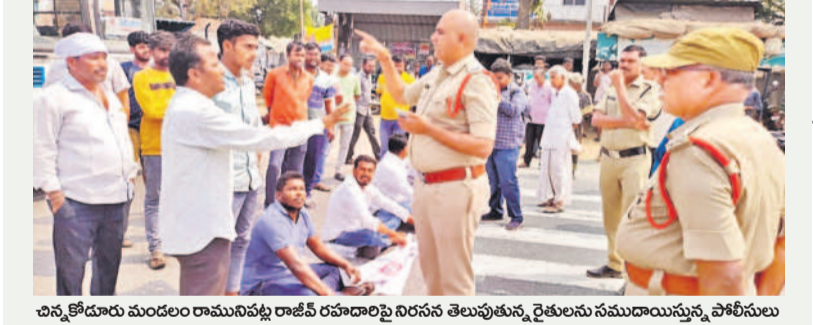
చిన్నకోడూరు మండలం రామనిపట్ట రాజీవ్ రహదారిపై నిరసన తెలుపుతున్న రైతులను సముదాయిస్తున్న పోలీసులు

డిమాండ్ చేశారు. సాగు చేసిన పంటలు ఎండిపోయే పరిస్థితి నెలకొందన్నారు. అధికారులకు ఎన్నిసార్లు మొరపెట్టుకున్నా పట్టించుకోవడం లేదన్నారు. పంటల కోసం పెట్టిన పెట్టుబడులు భారంగా మారాయన్నారు. ఇప్పటికైనా ఉన్నతాధికారులు స్పందించి సమస్యను పరిష్కరించాలన్నారు. రైతుల నిరసనతో రాజీవ్ రహదారిపై భారీగా ట్రాఫిక్ జామైంది. విషయం తెలుసుకున్న చిన్నకోడూరు పోలీసులు రైతులను సముదాయించి నిరసన విరమింపజేశారు. ఈ కార్యక్రమంలో ఆయా గ్రామాల రైతులు పాల్గొన్నారు.