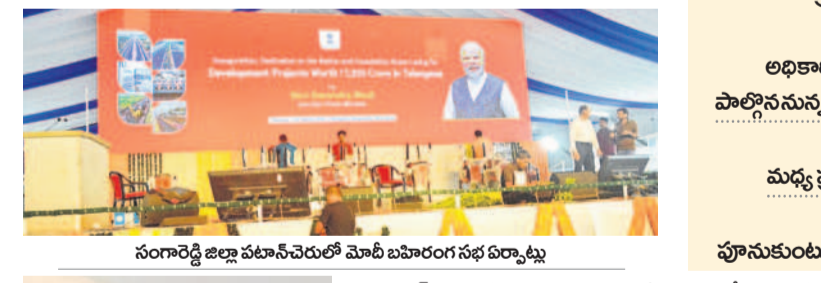
సంగారెడ్డి జిల్లా పటాన్చెరువులో మోదీ బహిరంగ సభ ఏర్పాటు

పటాన్చెరువు, మార్చి 4: సంగారెడ్డి జిల్లా పటాన్చెరువు ప్రధాని మోదీ వరుసవేల్గా పలు ఆవిష్కర్తలను చేపట్టారు. ప్రారంభోత్సవాలకు చేయూనున్నారు. మంగళవారం జిల్లాలో పర్యటిస్తున్న ఆయన పటాన్చెరువు పట్టణ పరిధిలోని పటాన్చెరువు వైశ్ణవ దేవాలయం వద్ద ప్రారంభోత్సవానికి సీఎం రేవంకెడ్డితో కలిసి హాజరవుతారు. అనంతరం పక్కనే ఉన్న గ్రాండ్లో జరిగే బహిరంగ సభలో పాల్గొంటారు. వరుసవేల్ విధానంలో పలు ప్రారంభోత్సవాలు, శంకుస్థాపనలు చేస్తారు. పక్కనే ఏర్పాటు చేసిన భారీ బహిరంగ