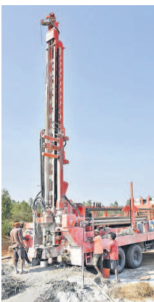
సిద్దిపేట జిల్లా అక్కన్నపేట మండలంలో బోరు వేస్తున్న రైతు