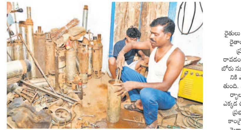
నారాయణరావుపేటలో కాలిపోయిన మోటారును రిపేరు చేస్తున్న మెకానిక్