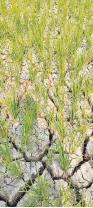
నంగునూరు మండలం సిద్దిపేటలో ఎండిపోయిన వరి పొలం

సిద్దిపేట, మార్చి 4 (సమస్తి తెలంగాణ ప్రతినిధి): కాంగ్రెస్ ప్రభుత్వంలో రైతులకు కరెంట్ కట్టాలు తప్పడం లేదు. వచ్చి పోయే విద్యుత్తో మోటార్లు కాలిపోతున్నాయి. తరచూ మోటార్లు కాలడంతో రైతులకు పెట్టుబడి తడిసి మోపెడవుతుంది. వారం రోజుల నుంచి గ్రామాల్లో బోరు మోటార్లు బాగా కాలిపోతున్నాయి. సరాసరి ఒక్కో మెకానిక్ రోజుకు పది నుంచి పదిహేను మోటార్ల వరకు ఘరమృతులు చేస్తున్నారు. కాంగ్రెస్ ప్రభుత్వం నాణ్యత లేని విద్యుత్ సరఫరా చేయడంతోనే ఇలా మోటార్లు కాలిపోతున్నాయని రైతులు వాపోతున్నారు. కేసీఆర్ ప్రభుత్వంలో నాణ్యమైన కరెంట్ రావడంతో మోటార్లు కాలలేదు. గంట పాటు ఎండలేదని రైతులు గుర్తు చేస్తున్నారు. మరో వైపు ఎండలు తారతమ్యం లేకుండా రోజు రోజుకూ భూగర్భజలాలు అడుగుంటుకున్నాయి. ఫలితంగా యాసంగిలో సాగు చేసిన వరి, మొక్కజొన్న తదితర పంటలు ఎండిపోతున్నాయి. పక్కనే రిజర్వాయర్లు ఉన్నా పూర్తి సామ్యంలో నీటిని విడుదల చేయకపోవడంతో రైతులు ఆందోళన చెందుతున్నారు. సిద్దిపేట జిల్లాలో 3,30,000 వేల ఎకరాలు, మెడక్ జిల్లాలో 2,60,000 ఎకరాలు, సంగారెడ్డి జిల్లాలో 83,000 ఎకరాల్లో వరి సాగు చేశారు. గత యాసంగిలో కనీసం కొంత మేర వరి సాగు విస్తీర్ణం తగ్గింది. ప్రస్తుత యాసంగిలో సాగుచేసిన వరి పొట్ల దశకు వచ్చింది. ఈ సమయంలో నీళ్లు పుష్పలంగా కావాలి. చెరువులు, కుంటలు, బోరు బావులు ఎండిపోకుండా రైతుల్లో ఆందోళన నెలకొన్నది.