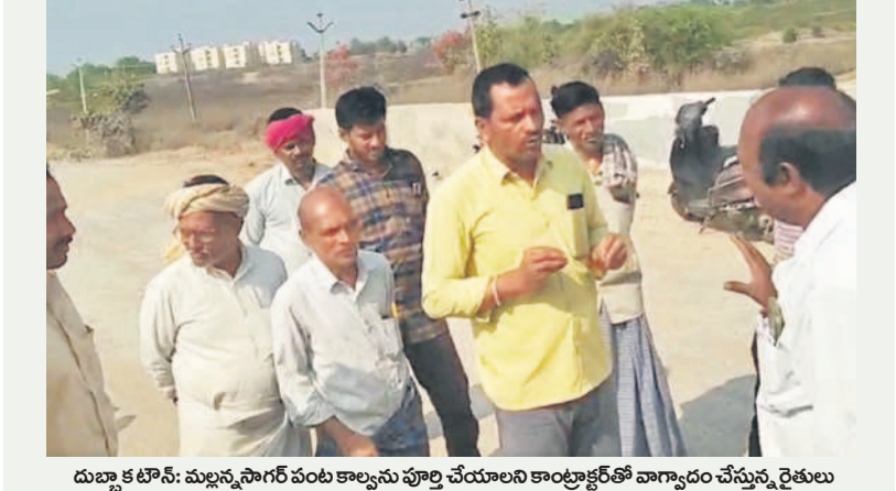
దుబ్బాక పోస్ట్, మల్లన్నసాగర్ పంట కాల్వను పూర్తి చేయాలని కాంగ్రెస్ ప్రభుత్వం వాగ్దారం చేస్తున్న రైతులు

పల్లి, పోతారం, చీకోడ్, ఆలేపల్లి గ్రామాల్లోని రైతులకు సాగునీరు అందేదన్నారు. ఓ పక్క మల్లన్నపల్లి, కమ్మరపల్లి ప్రాంతాలకు చెందిన రైతులు సిద్దిపేట జిల్లా దుబ్బాక నియోజకవర్గం చెల్లాపూర్ సమీపంలోని మల్లన్నసాగర్ ప్రధాన కాల్వ వద్ద సోమవారం నిరసన చేపట్టారు. ఈ సందర్భంగా రైతులు మాట్లాడుతూ నీళ్లు వస్తూ యన్న ఆశతో పంటలు సాగుచేసుకుంటే ప్రభుత్వ నిర్లక్ష్యం వల్ల ఎండిపోతున్నాయని ఆగ్రహం వ్యక్తం చేశారు. మల్లన్నసాగర్ ప్రాజెక్టు కాల్వలను దుబ్బాక ప్రాంతానికి తీసుకువస్తే కాంగ్రెస్ ప్రభుత్వం కనీసం 50 అడుగుల దూరం కాల్వలను తవ్వించలేదని ఆరోపించారు. కాల్వలను తవ్వించి ఉంటే మల్లన్నపల్లి, కమ్మరపల్లి, అచ్చుపూయ