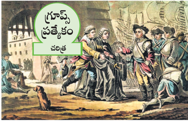
గ్రూప్ ప్రత్యేకం చరిత్ర

ఓడించబడి మరణించాడు. క్లైవ్ విజయం సాధించాడు. ఒప్పందం ప్రకారం మీర్జా ఫర్ బెంగాల్ నవాబు అయ్యాడు. ప్లాసీ యుద్ధానంతరం బెంగాల్ నవాబు అయిన మీర్జా ఫర్ ఆంగ్లేయులకు 24 పరగణాలు ఇవ్వడం జరిగింది. క్లైవ్ కు కొంత మొత్తాన్ని చెల్లించారు. క్లైవ్ 1758లో మొదటి బెంగాల్ గవర్నర్ గా నియమించారు. ప్లాసీ యుద్ధంతో బెంగాల్ లో బ్రిటిష్ సామ్రాజ్య స్థాపన జరిగినట్లు అయింది. క్లైవ్ తర్వాత బెంగాల్ గవర్నర్ గా వాన్ సిట్టార్డ్ (1760-65) నియమించబడ్డాడు. ఈ బెంగాల్ నవాబు మీర్జా ఫర్ ను తొలగించి మీర్ ఖాసిం ను బెంగాల్ నవాబుగా నియమించాడు. అందుకు ప్రతిఫలంగా ఆంగ్లేయులకు మీర్ ఖాసిం బర్మాన్, మిర్జాపూర్, చిట్టాగంగ్ ప్రాంతాలను ఇచ్చారు.