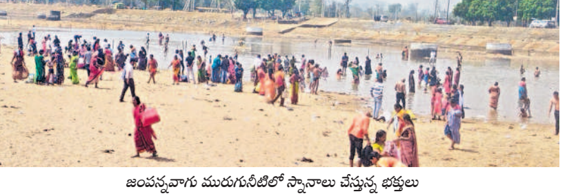
జంపన్నవారు మురుగునీటిలో స్నానాలు చేస్తున్న భక్తులు

కార్జులూ, మార్చి 3 : సమస్త కర్ణాటక-సారలమ్మను దర్శించుకునేందుకు భక్తులు అధిక సంఖ్యలో రావడంతో మేడారం పరిసరాల్లో కోలాహలంగా మారాయి. అధికారం సెలవు కావడంతో తెలుగు రాష్ట్రాలలో పాటు పక్క రాష్ట్రాల నుండి భక్తులు తరలివచ్చారు. 19 ఏళ్ల తర్వాత పనులు పూర్తి చేసారు.