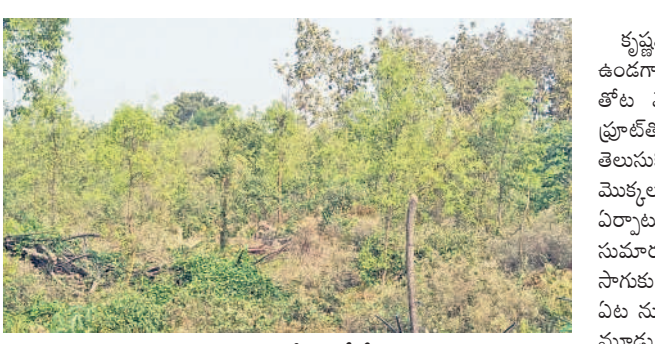
కృష్ణమూర్తి వ్యవసాయ క్షేత్రంలో శ్రీగంధం చెట్టు

డ్రాగన్ ఫ్రూట్, శ్రీగంధం, మహాగని, తైవాన్ జామ, మల్లర్ తోటల సాగుతో సత్పితాలు నేరుగా వినియోగదారులకు విక్రయాలూ.. ఆదర్శంగా నిలుస్తున్న రేపాకపల్లి రైతు