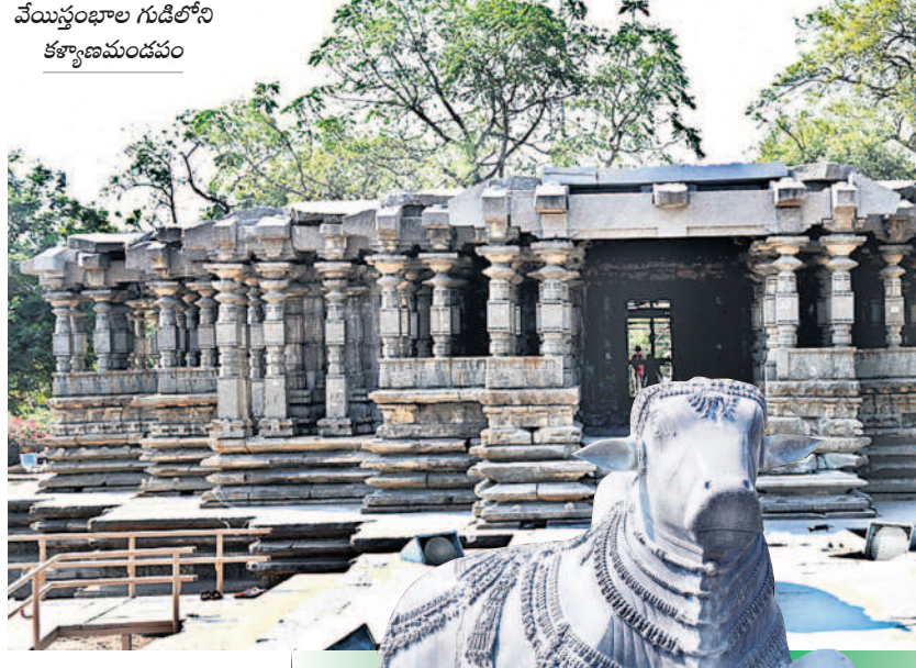
వేయిస్తంభాల గుడిలోని కళ్యాణమండపం