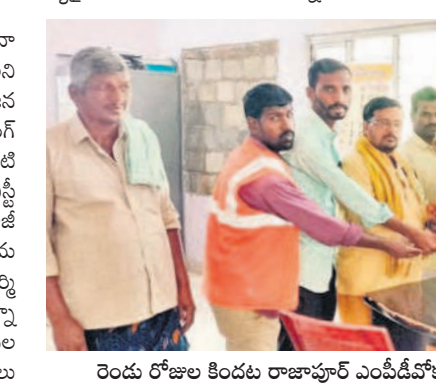
రెండు రోజుల కిందట రాజాపూర్ ఎంపీ డి.వో.కె. వినయవ్రతం అందజేస్తున్న పంచాయతీ కార్యక్రమం

నిలదీస్తున్నారు. రూ.లక్షలాది జీతాలు తీసుకునే అధికారులు వారం రోజులు వేతనాలు రాకుంటేనే గోల చేస్తారంటే మనమేమీలే తిక్కెస్తున్నది. నెలలుగా పెండింగ్.. జిల్లాలోని 255 గ్రామ పంచాయతీలకు గానూ అన్ని గ్రామ పంచాయతీల్లో దాదాపు రెండు నెలల జీతాలు పారిశుధ్యకార్యక్రమ అందాల్సి ఉన్నది. జనవరి, ఫిబ్రవరి వేతనాలు రావాలి. ఫిబ్రవరి ఒకటో తేదీలో సర్కారుకు పడవీకాలం ముగియడంతో జనవరిలోనే జీతం అందాల్సి ఉంది. కానీ అయ్యాయి. కొన్ని చిన్న గ్రామ పంచాయతీల్లో డబ్బులు లేక కార్యక్రమం వేతనాలు ఇవ్వలేదు. అప్పటికే ఉన్న డబ్బులన్నీ చేసిన పనులకు ఖర్చు కావడం.. ఇంకా కొన్ని పనులకు సరిపోకపోవడం వంటి పరిస్థితులు అనేక గ్రామ పంచాయతీల్లో లెక్కాన్ని ఉన్నాయి. చివర దశ పడవీ కాలంలో ఉన్న సర్కారులు కొందరు ఉన్న డబ్బులను తీసుకునే ప్రయత్నం చేయడంతో జీతం అందాల్సి ఉన్న భాగి అయ్యాయి. ఇలా అన్ని సమస్యలు నేడు గ్రామాల్లో పనిచేస్తున్న కార్యక్రమం కు డబ్బుకేవలం వేతనాలందలేదు. చిన్న జీతాల్లో ట్రాక్టర్ కుతులు, కలింట్ బిల్లులకు చెల్లింపులు చేయడంతో కార్యక్రమ వేతనాలకు ట్రేజీ పడుతూ వచ్చింది. పెండింగ్ తో వస్తుంది..