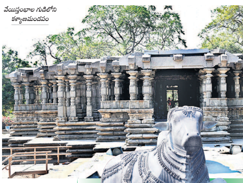
వేయిస్తంభాల గుడిలోని కళ్యాణమండపం