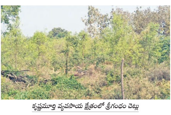
కృష్ణమూర్తి వ్యవసాయ క్షేత్రంలో శ్రీగంధం చెట్టు

డ్రాగన్ ఫ్రూట్, శ్రీగంధం, మహాగని, తైవాన్ జామ, మల్లర్ తోటల సాగుతో సత్పితాలు నేరుగా వినియోగదారులకు విక్రయాలూ.. ఆదర్శంగా నిలుస్తున్న రేవాకపల్లి రైతు