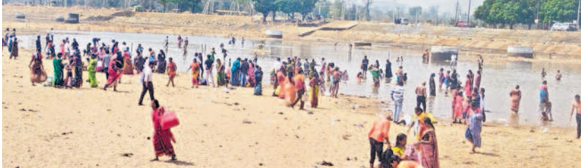
జంపన్నవారి మురుగునీటిలో స్నానాలు చేస్తున్న భక్తులు

గద్దెల పరిసరాలు భక్తులతో కిక్కిరిసిపోయాయి. అదివారం రెండు లక్షల మంది భక్తులు అమ్మవార్లను దర్శించుకున్నట్లు తెలిపారు. స్నానాలకు నీళ్లు లేక ఇక్కట్లు భక్తులు పుణ్యస్థానాలు చేయడానికి జంపన్నవారి గుర్తు నీళ్లు లేకపోవడంతో ఇబ్బందులు పడ్డారు. జాతర ముగియడంతో వాగులో భక్తుల కోసం ఏర్పాటు చేసిన బ్యాటరీ ఆఫ్ ట్యాంకులు తొలగించారు. నీళ్లు లేకపోవడంతో అధికారులు తీరుపై ఆగ్రహం వ్యక్తం చేశారు. వాగులో నీలి చిన్న మురుగు నీటిలోనే స్నానం చేసి మొక్కులు చెల్లించుకుంటున్నారు. జంట వంతెనల వద్ద తాత్కాలిక బ్యాటరీ ఆఫ్ దేవాదాయశాఖ అధికారులు ఏర్పాటు చేసినారు. ఈసారి అధికారులు భక్తులకు సౌకర్యాలను కల్పించడంలో నిర్లక్ష్యంగా వ్యవహరించినట్లు ఆరోపణలు వస్తున్నాయి.