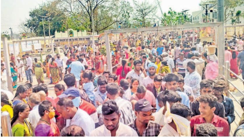
వినదేవితల సన్నిధిలో అమ్మవార్ల దర్శనానికి వస్తున్న భక్తులు

బీఆర్ఎస్ అధినేత కేసీఆర్ హాజరై ఆయా నియోజకవర్గాల నేతల నుంచి అభిప్రాయాలు సేకరించనున్నారు. ఇందుకోసం ఇప్పటికే కొందరు నాయకులు మహబూబాబాద్ చేరుకోగా, మరి కొంతమంది సోమవారం వెళ్తున్నారు. ఎమ్మెల్యేలు, ఎమ్మెల్యేలు, ఎంపీతోపాటు మాజీ ఎమ్మెల్యేలు, మాజీ ఎమ్మెల్యేలు, ఇతర ముఖ్య నాయకులు ఈ సమావేశంలో పాల్గొనున్నారు. ఈ సమావేశంలోనే బీఆర్ఎస్ పార్లమెంట్ అభ్యర్థి ఎవరనేది వెల్లడి కానుంది.