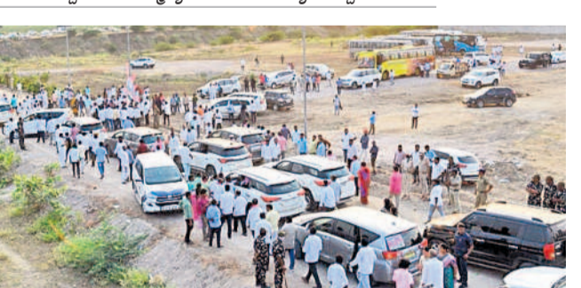
మేడిగడ్డ బరాజ్ వద్ద బీఆర్ఎస్ నాయకులు