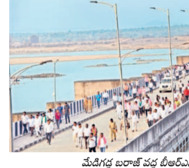
మేడిగడ్డ బరాజ్ వద్ద బీఆర్ఎస్ శ్రేణులు

చలో మేడిగడ్డ కార్యక్రమం పోలీసుల తీరుతో కొద్దిసేపు ఉద్రిక్తంగా మారింది. కేటీఆర్ బృందం వెళ్తున్న నేపథ్యంలో అక్కడికి చేరుకున్న బీఆర్ఎస్ కార్యకర్తలను పోలీసులు ట్రిడ్డి మెయిన్ గేట్ మూసివేసి అనుమతించకపోవడంతో కార్యకర్తలు ఆందోళన చేశారు. మెయిన్ గేట్ తీసుకొని ట్రిడ్డి వెళ్లడం ప్రయత్నించిన బీఆర్ఎస్ కార్యకర్తలు, పోలీసులకు మధ్య తోపులాట జరిగింది. ఈ క్రమంలో కార్యకర్తలకు స్వల్ప గాయాలయ్యాయి. తొక్కిసలాటలో ఓ మహిళా కార్యకర్త కిందపడింది.