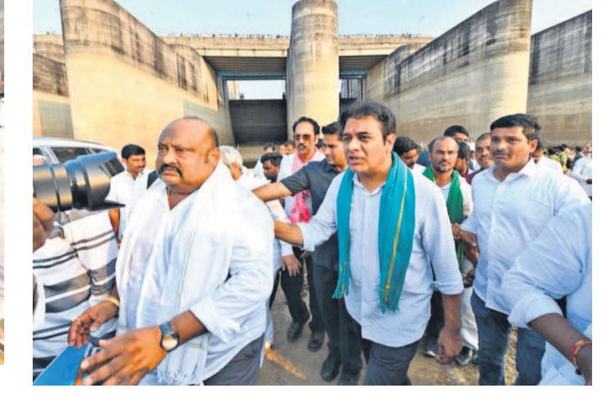
మేడిగడ్డ వద్ద కేటీఆర్, ఎమ్మెల్యేలు మాగుంటి గోపీనాథ్, గంగుల కమలాకర్, తదితరులు