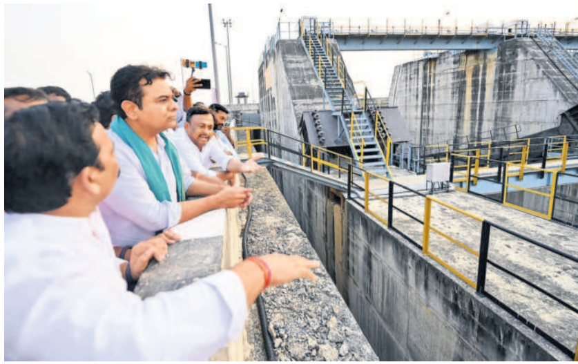
అన్నారం ప్రాజెక్టును పరిశీలిస్తున్న కేటీఆర్