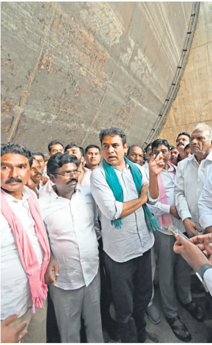
మేడిగడ్డ ప్రాజెక్టును పరిశీలిస్తున్న బీఆర్ఎస్ పార్టీ వర్కింగ్ ప్రెసిడెంట్ కల్వకుంట్ల తారకరామారావు, ఎమ్మెల్యేలు, మాజీ ఎమ్మెల్యేలు, తదితరులు