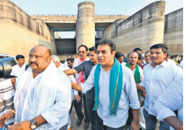
మేడిగడ్డ వద్ద కేటీఆర్, ఎమ్మెల్యేలు మాగంటి గోపీనాథ్, గంగంల కమలాకర్