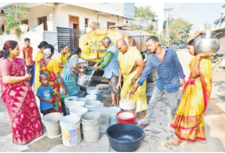
22వ డివిజన్ సుభాషినగర్లో సగర పాలక సంస్థ ట్యాంకర్ నీటిని పట్టుకుంటున్న కాలనీవాసులు

ఇంకా వేసవి ఆరంభం కానేలేదు. ఎండలు ముదననే లేదు. కానీ, అప్పుడే కరీంనగర్ లో నీటి కటకట మొదలైంది. నాలుగైదేండ్లుగా లేని నీటి సమస్య మళ్ళీ ఇబ్బంది పెడుతున్నది. పది పదిహేను రోజులుగా హైలెవల్ జోన్ లోని ఏడు డివిజన్ల ప్రజలు నల్లగొండ ఎప్పుడు వస్తుందా? అని ఎదురుచూస్తున్నారు. రోజూ విడిచి రోజూ నీటిని సరఫరా చేస్తుండడం, అది లోపైపై తో ఇస్తుండడంతో సరిపోక ట్యాంకర్ల కోసం పడిగాపులు గాస్తున్నారు. గతంలో కేసీఆర్ సర్కారు అర్బన్ మిషన్ భగీరథతో తాగునీటి కష్టాలిల్లించి, మండలంలోని రోజూ నీటిని సరఫరా చేస్తున్నారు. కానీ, ఇప్పుడు మళ్ళీ గోసపడే రోజులు వచ్చాయి. ఇప్పుడే ఇలా ఉంటే మున్నగు పరిస్థితి ఎలా ఉంటుందోనని ఆందోళన వ్యక్తం చేస్తున్నారు.