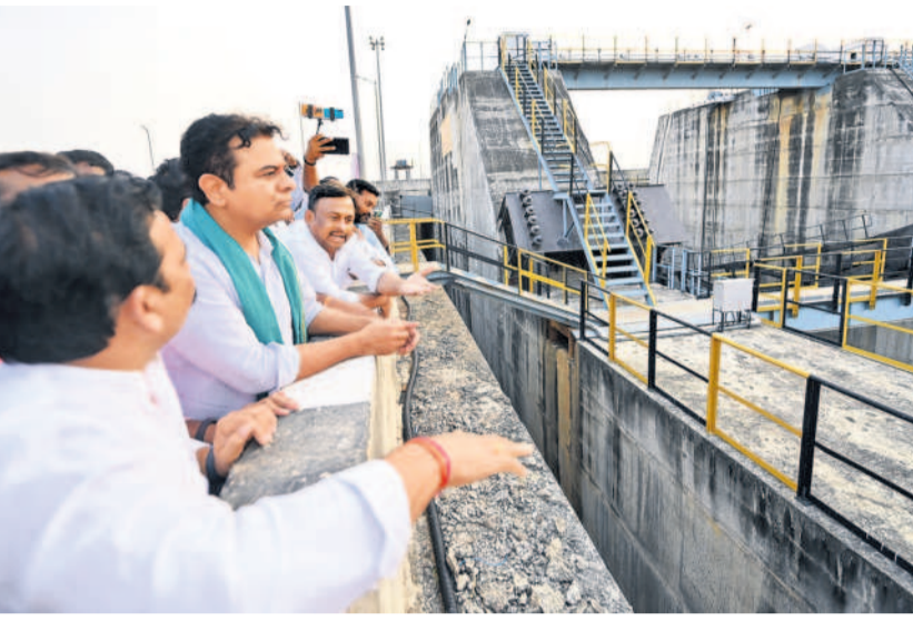
అన్నారం ప్రాజెక్టును పరిశీలిస్తున్న కేటీఆర్