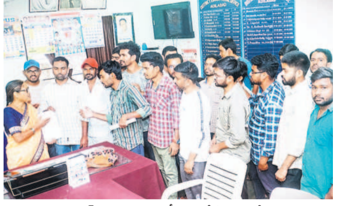
అదిలాబాద్ జిల్లా విద్యాశాఖ కార్యాలయం ఎదుట నిరుద్యోగులు

అదిలాబాద్, మార్చి 1 (నమస్తే తెలంగాణ): ప్రభుత్వం విడుదల చేసిన డీఎస్సీ నోటిఫికేషన్ అదిలాబాద్ జిల్లా నిరుద్యోగులను గందరగోళానికి గురి చేస్తున్నది. జిల్లాలోని ప్రభుత్వ పాఠశాలల్లో ఉపాధ్యాయ ఖాళీలు ఎక్కువగా ఉన్నాయని విద్యాశాఖ అధికారులు తక్కువ చూపారంటూ నిరుద్యోగులు ఆందోళనలు దిగారు. జిల్లా విద్యాశాఖ ప్రజాతన కలిసి ఖాళీల విషయంలో స్పష్టత ఇవ్వాలని డిమాండ్ చేశారు. ప్రభుత్వం గురువారం విడుదల చేసిన డీఎస్సీ నోటిఫికేషన్లో అదిలాబాద్ జిల్లాలో 824 ఉపాధ్యాయ పోస్టులు ఖాళీగా ఉన్నాయి. వీటిలో నెకండర్ గ్రేడ్ బీదర్ 209, నెకండర్ గ్రేడ్ బీదర్ (స్పెషల్ ఎడ్యుకేషన్) 19, సూపర్ అసిస్టెంట్ 80, లాంగ్ గ్రేడ్ పండిట్లు 14, పీఠాల్లో పోస్టులు 2 ఖాళీగా ఉన్నాయి. ఇందుకు సంబంధించిన నోటిఫికేషన్ను డీఐఎస్సీ కార్యాలయంలో అందుబాటులో ఉంచారు. జిల్లాలో గత డీఎస్సీ ప్రకటనలో పోల్కితే కేవలం మాడు ఎస్సీలో పోస్టులు మాత్రమే పెరగడంతో, ఎల్ఎస్ఎస్ఎల్సీలో ఉపాధ్యాయ నియామక ప్రకటన కోసం ఎదురుచూస్తున్న అభ్యర్థులకు నిరాశ ఎదురైంది. రాష్ట్ర వ్యాప్తంగా పోస్టుల సంఖ్య వందల సంఖ్యలో పెరిగితే, అదిలాబాద్ జిల్లాలో మాత్రం స్వల్పంగా పెరిగిందని, ఇందుకు అధికారంలో కారణమని ఆగ్రహం వ్యక్తం చేస్తున్నారు.