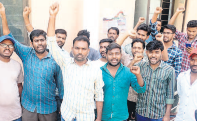
జిల్లా విద్యాశాఖ కార్యాలయం ఎదుట నిరుద్యోగులు ఆందోళన