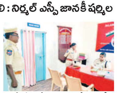
పోలీస్ స్టేషన్లో రికార్డులను పరిశీలిస్తున్న ఎస్సీ

ఫిర్యాదులపై వెంటనే స్పందించాలి: నిర్మల్ ఎస్సీ జానకీ పల్లె దిలావరపూర్, మార్చి 1: పోలీస్ స్టేషన్కు వచ్చే ఫిర్యాదులకు వెంటనే స్పందించి, బాధితులకు సరైన న్యాయం చేయాలని నిర్మల్ ఎస్సీ జానకీ పల్లెల ఆనందం. మండల కేంద్రంలోని పోలీస్ స్టేషన్ను ఆమె శుభ్రకారం తనిఖీ చేశారు. ఆనందం రికార్డులను పరిశీలించారు. సిబ్బందితో మాట్లాడి, స్టేషన్ పరిధిలోనే నేరాలపై ఆరా తీశారు. ఆనందం మాట్లాడుతూ పోలీస్ స్టేషన్కు వచ్చే వారి పట్ల అసభ్య కరంగా మాట్లాడవద్దని, వారితో మర్యాదగా మాట్లాడి సమస్యను పరిష్కరించేందుకు కృషిచేయాలని కోరారు. గ్రామాల్లో సీసీ కెమెరాల ఏర్పాటుకు కృషి చేయాలని, వాటి గురించి గ్రామాల్లో అవగాహన కల్పించాలని అడిగినారు. అర్థిక సైబర్ నేరాలపై ప్రజలకు అవగాహన కల్పించాలని కోరారు. మండలంలో ఏవిధమైన అసామంతు కార్యక్రమాలు జరుగుతుంటే ప్రత్యేక దృష్టి పెట్టాలని, శివరాత్రి సందర్భంగా కదిలి ఆలయం వద్ద భక్తులకు ఇబ్బందులు కలుగుతుంటే బందోబస్తు ఏర్పాటు చేయాలని కోరారు. ఎన్ఐఐ సహాయంతో, పోలీస్ సిబ్బంది ఉన్నారని తెలిపారు.