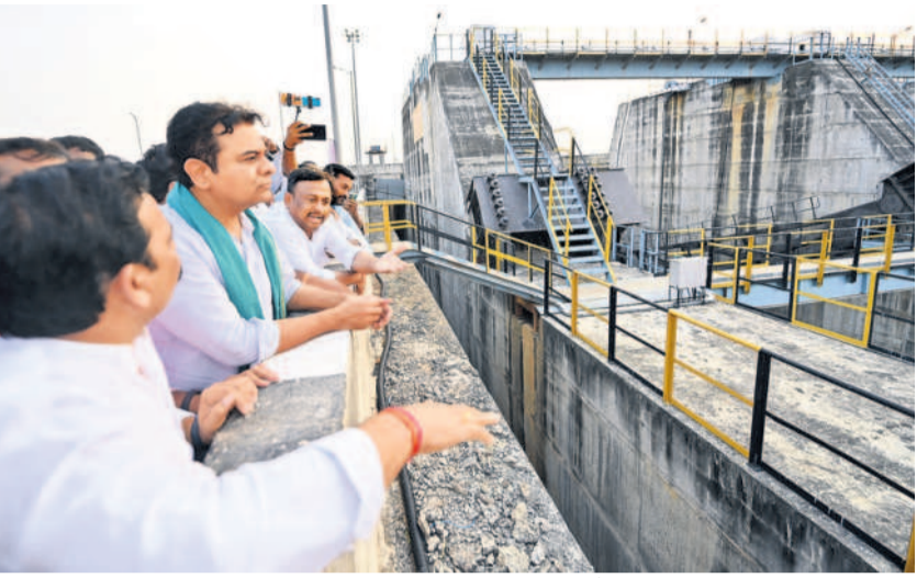
అన్నారం ప్రాజెక్టును పరిశీలిస్తున్న కేటీఆర్