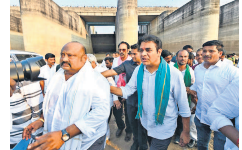
మేడిగడ్డ వద్ద కేటీఆర్, ఎమ్మెల్యేలు మాగంటి గోపీనాథ్, గంగుల కమలాకర్, తదితరులు