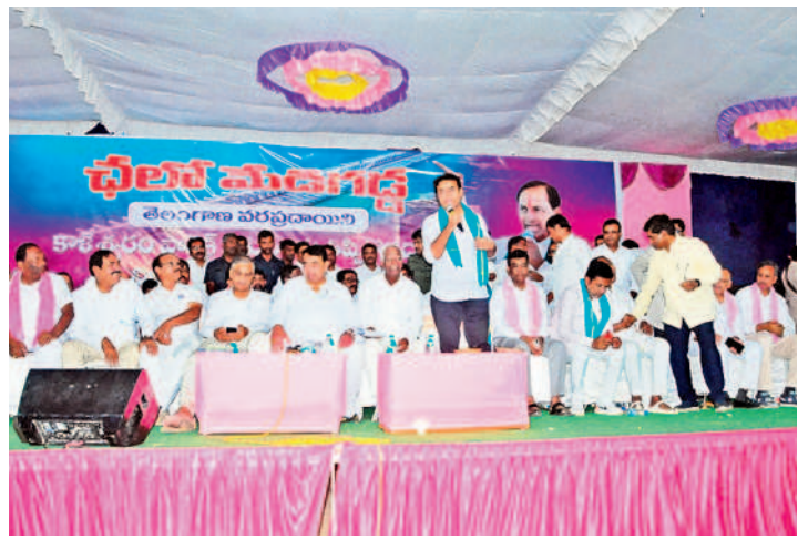
అన్నారం బరాజ్ వద్ద ఏర్పాటు చేసిన సమావేశంలో మాట్లాడుతున్న కేటీఆర్

జయశంకర్ భూపాలపల్లి, మార్చి 1 (నమస్తే తెలంగాణ) : కాశీశ్వరం ప్రాజెక్టుపై కాంగ్రెస్ పార్టీ చేస్తున్న కుట్రలను ప్రజల ముందు బీఆర్ఎస్ బయటపెట్టింది. నాలుగు నెలల క్రితం మేడిగడ్డ బరాజ్ లో ఒక ఫిల్టర్ కుంగగా కాంగ్రెస్ ప్రభుత్వం మరమ్మతులు చేయకుండా వివారణ పేరుతో జాప్యం చేస్తుండడంపై బీఆర్ఎస్ అగ్రహం వ్యక్తం చేసింది. ఈ నేపథ్యంలో రైతులు, ప్రజలకు నిజానిజాలు తెలియజేసేందుకు శుభవారం 'కాశీశ్వరం యాత్ర' చేపట్టగా పార్టీ చరిత్రాంగ ప్రెసిడెంట్ కేటీఆర్, మాజీ మంత్రి హరిశ్చంద్రావు సహా బీఆర్ఎస్ ప్రజాప్రతినిధులు, సీనియర్ నాయకులు, మాజీ మంత్రులు, ఎమ్మెల్యేలు కలిసి మేడిగడ్డ, అన్నారం బరాజ్ లను పరిశీలించారు. ప్రభుత్వం వెంటనే స్పందించి వాస్తవాలలోగా బరాజ్ మరమ్మతులు చేసి రైతులకు నీటిని అందించాలని నాయకులు కేటీఆర్ డిమాండ్ చేశారు. కాంగ్రెస్ ప్రభుత్వం కావాలనే బీఆర్ఎస్ ను బద్దనాం చేసేందుకు మేడిగడ్డ అంశాన్ని రాద్ధాంతం చేస్తున్నదని, కాశీశ్వరాన్ని నీటిపాలు చేసే కుట్రలు చేస్తున్నదని రైతులకు వివరించగా, అన్నారం బరాజ్ వద్ద బీఆర్ఎస్ బృందానికి, రైతులకు మాజీ మంత్రి హరిశ్చంద్రావు, ఎమ్మెల్యే కడియం శ్రీహరి పవర్ పాయింట్ ప్రజెంటేషన్ ద్వారా అవగాహన కల్పించారు.