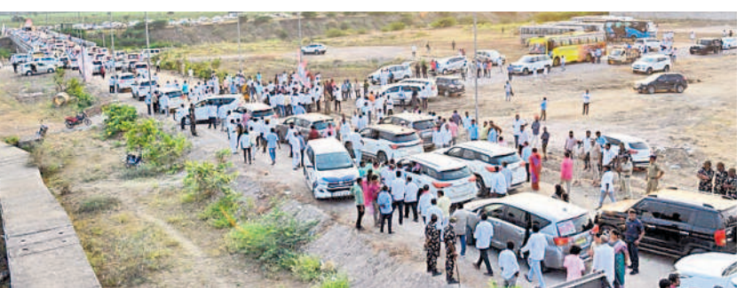
మేడిగడ్డ బరాజ్ వద్ద బీఆర్ఎస్ నాయకులు