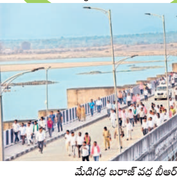
మేడిగడ్డ బరాజ్ వద్ద బీఆర్ఎస్ శ్రేణులు

చలో మేడిగడ్డ కార్యక్రమం పోలీసుల తీరుతో కొద్దిసేపు ఉద్రిక్తంగా మారింది. కేటీఆర్ బృందం వెళ్తున్న నేపథ్యంలో అక్కడికి చేరుకున్న బీఆర్ఎస్ కార్యకర్తలను పోలీసులు బ్రిడ్జి మెయిన్ గేట్ మూసివేసి అనుమతింపజేయకుండా కార్యకర్తలు ఆందోళన చేశారు. మెయిన్ గేట్ తీసుకొని బ్రిడ్జికి వెళ్లడం ప్రయత్నించిన బీఆర్ఎస్ కార్యకర్తలు, పోలీసులకు మధ్య తోపులాట జరిగింది. ఈ క్రమంలో కార్యకర్తలకు స్వల్ప గాయాలయ్యాయి. తొక్కినలాటలో ఓ మహిళా కార్యకర్త కిందపడింది.