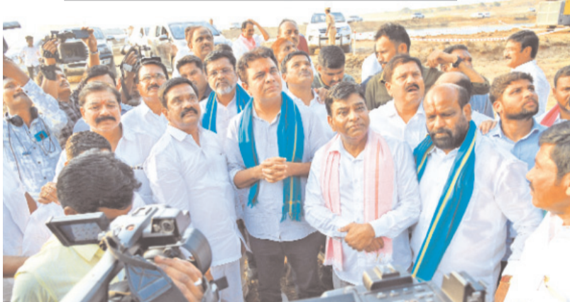
మేడిగడ్డ ప్రాజెక్టు వద్ద బీఆర్ఎస్ వర్కింగ్ ప్రెసిడెంట్ కేటీఆర్, ఎంపీ నామ నాగేశ్వరరావు, ఎమ్మెల్యే వేముల ప్రకాశ్ రెడ్డి, మాజీ మంత్రి నిరంజన్ రెడ్డి, తదితరులు