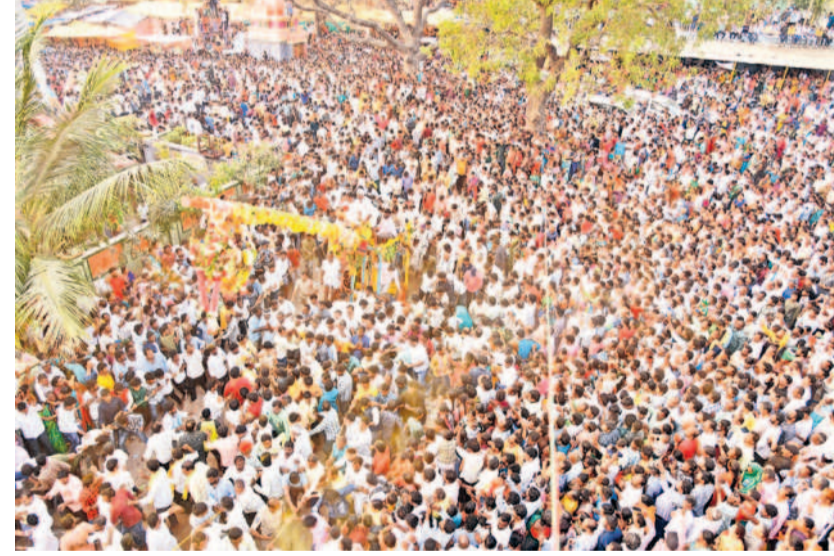
పోలేపల్లి ఎల్లమ్మ ఉత్సవాల్లో భాగంగా సిడి నిర్వహిస్తున్న భక్తులు

సమయంలో పలువురు భక్తులు పూసలు నిండారు. భక్తులు వేపాకు, పసుపు, గవ్వలు కలిపిన గవ్వల బాదాను అమ్మవారిపైకి విసరగా.. గవ్వలను ఏరుకోవడానికి భక్తులు పోటీ పడ్డారు. పోతరాజుల విన్యాసాలు జాతరలో ఆకర్షణగా నిలిచాయి.