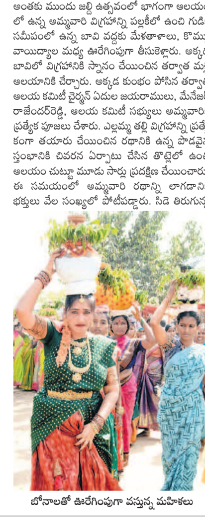
బోనాలతో ఊరేగింపుగా వస్తున్న మహిళలు

బొంబాయి/కొత్తి, మార్చి 1 : పోలేపల్లి ఎల్లమ్మ సిడి ఉత్సవం కనులపండువగా సాగింది. తెలంగాణలో పాటు పక్క రాష్ట్రాల నుంచి భక్తులు వేలాదిగా తరలి రాగా.. వారి సమక్షంలో వేడుక ఆధ్వర్యంలో ఆనంద భరితంగా జరిగింది. విశాఖాబాద్ జిల్లా దుర్గాల మండలంలోని పోలేపల్లి ఎల్లమ్మ జాతర వైభవంగా జరుగుతున్నది. ఉత్సవాల్లో ప్రధాన ముఖ్యమైన సిడి కార్యక్రమం శుక్రవారం సాయంత్రం నయనానందకంగా నిర్వహించారు. ఎల్లమ్మ తల్లి.. మమ్మల్ని చల్లగా చూడమ్మా.. అన్న నామస్మరణ మార్చిగింది. భక్తుల కేరింతలు, జయజయ ధ్వనులు ఓవైపు.. మేళాశాలు, డప్పు చప్పుళ్లు మరో వైపు జాతరకే హైలైట్.. మహిళలు పూసలతో ఊగిపోయారు. సాయంత్రం సిడి వేడుక 15 నిమిషాలపాటు శోభాయమానంగా జరిగింది.