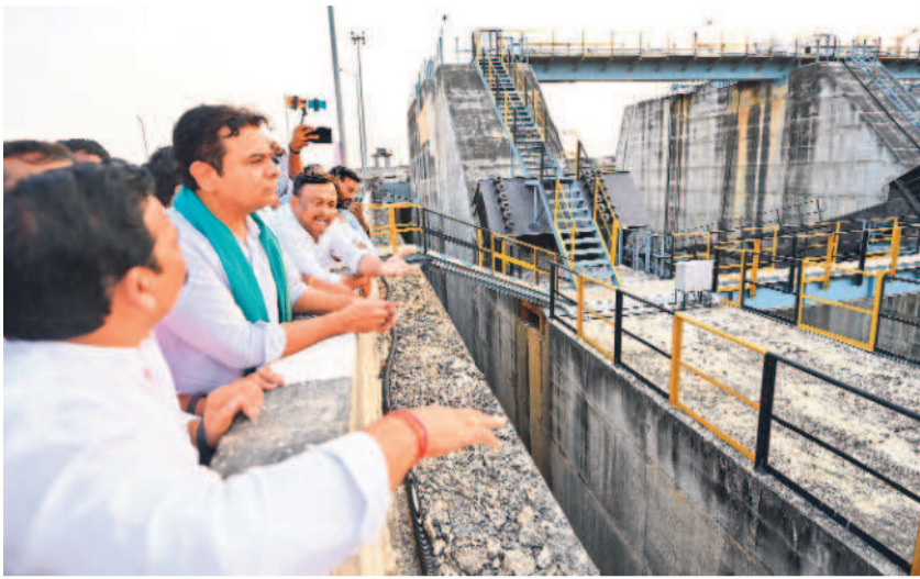
అన్నారం ప్రాజెక్టును పరిశీలిస్తున్న కేటీఆర్