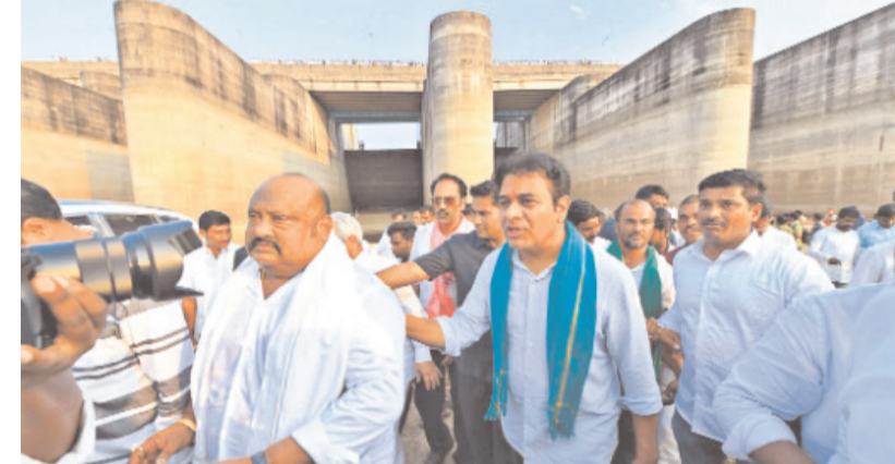
మేడిగడ్డ వద్ద కేటీఆర్, ఎమ్మెల్యేలు మాగంటి గోపీనాథ్, గంగుల కమలాకర్, తదితరులు