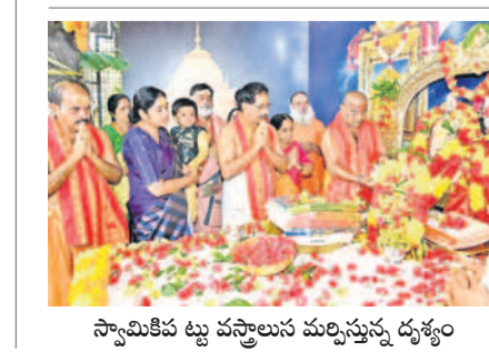
స్వామికి పట్టు వస్తూనే మర్రిపూజ దృశ్యం