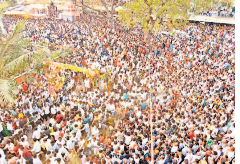
పోలేపల్లి ఎల్లమ్మ ఉత్సవాల్లో భాగంగా సిడె నిర్వహిస్తున్న భక్తులు

సమయంలో పలువురు భక్తులు పూసకాలు నిండారు. భక్తులు వేపాకు, పసుపు, గవ్వలు కలిపిన గవ్వల బాదాను అమ్మవారిపైకి విసరగా.. గవ్వలను ఏరుకోవడానికి భక్తులు పోటీ పడ్డారు. పోతరాజుల విన్యాసాను జాతరలో ఆకర్షణగా నిలిచాయి.