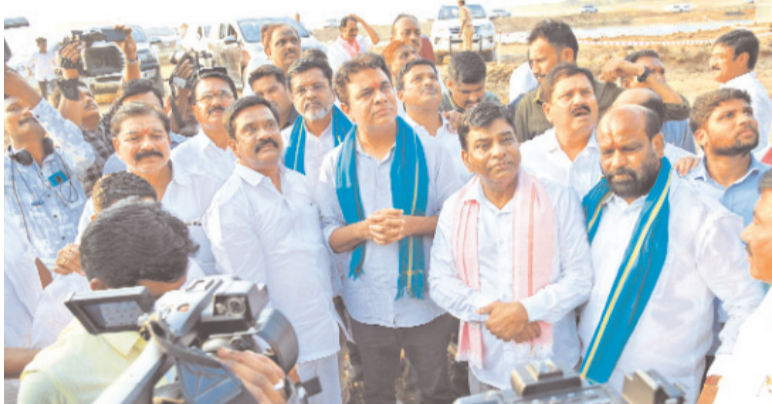
మేడిగడ్డ ప్రాజెక్టు వద్ద బీఆర్ఎస్ వర్కింగ్ ప్రెసిడెంట్ కేటీఆర్, ఎంపీ నామ నాగేశ్వరరావు, ఎమ్మెల్యే వేముల ప్రకాశ్ రెడ్డి, మాజీ మంత్రి నిరంజన్ రెడ్డి, తదితరులు