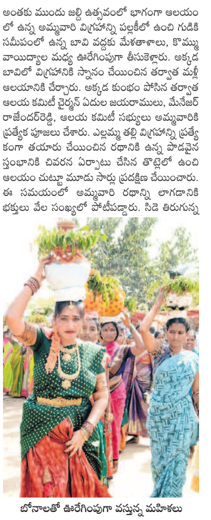
బోనాలతో ఊరేగింపుగా వస్తున్న మహిళలు

బొంబాయి/కొస్గి, మార్చి 1 : పోలేపల్లి ఎల్లమ్మ సిడె ఉత్సవం కనులపండువగా సాగింది. తెలంగాణలో పాటు పక్క రాష్ట్రాల నుంచి భక్తులు వేలాదిగా తరలి రాగా.. వారి సమక్షంలో వేడుక ఆధ్వర్యంలో ఆనంద భరితంగా జరిగింది. విశాఖాబాద్ జిల్లా దుర్గాల మండలంలోని పోలేపల్లి ఎల్లమ్మ జాతర వైభవంగా జరుగుతున్నది. ఉత్సవాల్లో ప్రధాన ముఖ్యమైన సిడె కార్యక్రమం శుక్రవారం సాయంత్రం నయనానందకంగా నిర్వహించారు. ఎల్లమ్మ తల్లి.. మమ్మల్ని చల్లగా చూడమ్మా.. అన్న నామస్మరణ మార్చిగింది. భక్తుల కేరింతలు, జయజయ ధ్వనులు ఓవైపు.. మేళాకాలు, డప్పు చప్పుళ్లు మరో వైపు జాతరకే హైలైట్.. మహిళలు పూసకాలతో ఊగిపోయారు. సాయంత్రం సిడె వేడుక 15 నిమిషాలపాటు శోభాయమానంగా జరిగింది.