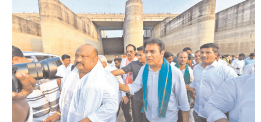
మేడిగడ్డ వద్ద కేటీఆర్, ఎమ్మెల్యేలు మాగంటి గోపీనాథ్, గంగుల కమలాకర్, తదితరులు