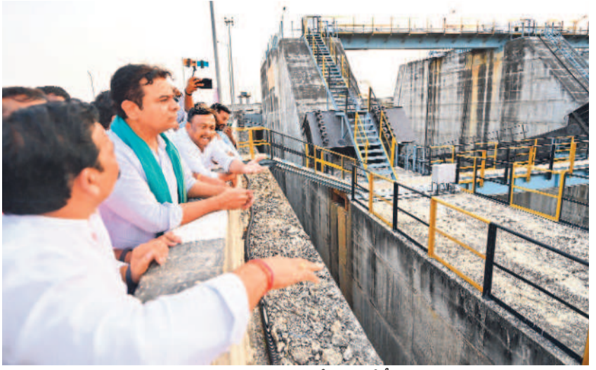
అన్నారం ప్రాజెక్టును పరిశీలిస్తున్న కేటీఆర్