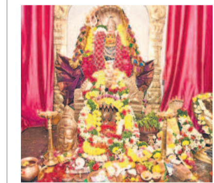
పోలేపల్లిలోని ఎల్లమ్మ తల్లి మూలాలలో