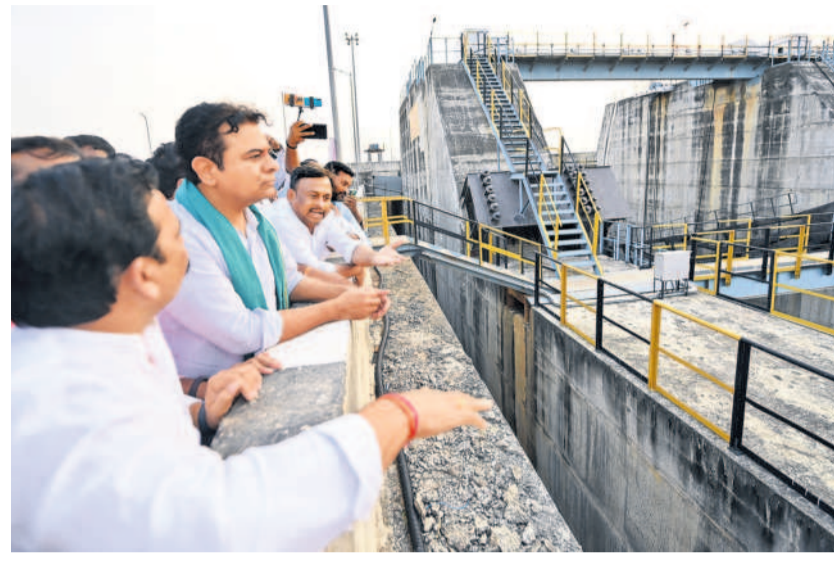
అన్నారం ప్రాజెక్టును పరిశీలిస్తున్న కేటీఆర్