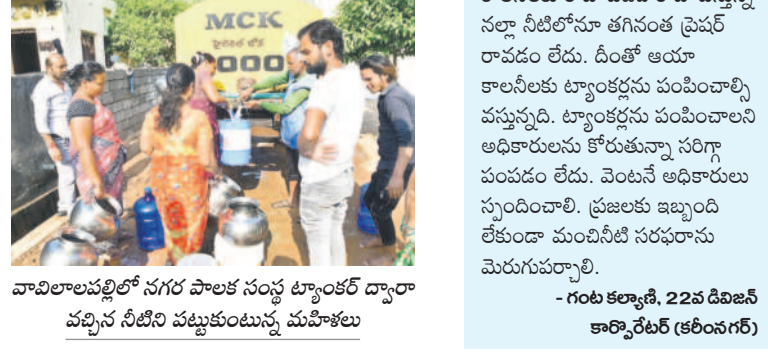
వావిలాలపల్లిలో సగర పాలక సంస్థ ట్యాంకర్ ద్వారా వచ్చిన నీటిని పట్టుకుంటున్న మహిళలు

ఉండడంతో రా వాటర్ తీసుకోవడానికి బ్యాస్టర్ల పంపులను వాడుతున్నారు. ఫిల్టర్ బెడ్ నుంచి మొయినీ బ్యాస్టర్ లింగ్ రిజర్వాయర్ కు పంపింగ్ చేసేందుకు మోటార్లు ఎక్కువగా వినియోగిస్తున్నారు. అయినా వల్ల ఆయా రిజర్వాయర్లను పూర్ణస్థాయిలో నింపలేకపోతున్నారు. ఈ కారణంగానే నీటి సరఫరాలో సమస్యలు తలెత్తుతుండగా, ఆయా డివిజన్ల ప్రజలు ట్యాంకర్ల కోసం ఎదురుచూడాలి, భూగర్భ జలాలు పడిపోతాయని, బోర్ లోనూ అడుగుంటుతాయని ఆందోళన వ్యక్తం చేస్తున్నారు. ఎల్ఎండీలో నీటిమట్టం తగ్గిందని అధికారులు చెబుతున్నారని విమర్శిస్తున్నారు. కానీ, గతంలో ఎల్ఎండీలో నీళ్లు తగ్గినప్పుడు మిడిమానేరు నుంచి నీటిని విడుదల చేసి సమస్య రాకుండా చూసేవారని గుర్తు చేస్తున్నారు. ఈ సారి అలా ఎందుకు చేయడం లేదని మండిపడుతున్నారు. ఇప్పటికైనా అధికారులు స్పందించాలని, ప్రతి రోజూ నీరు దొందాలని కోరుతున్నారు.