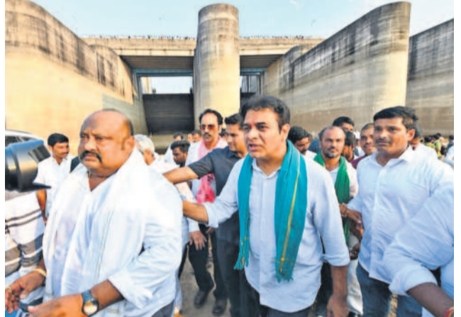
మేడిగడ్డ వద్ద కేటీఆర్, ఎమ్మెల్యేలు మాగంటి గోపీనాథ్, గంగంల కమలాకర్