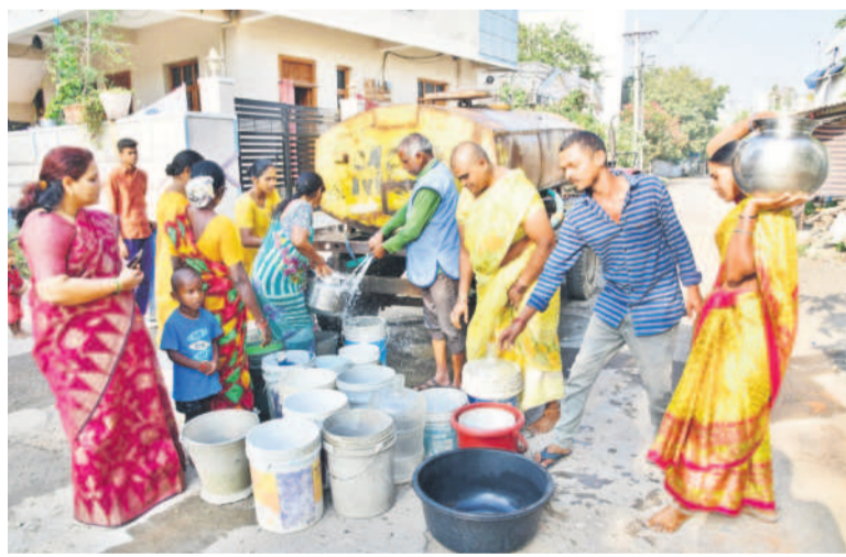
22వ డివిజన్ సుభాషినగర్ లో సగర పాలక సంస్థ ట్యాంకర్ నీటిని పట్టుకుంటున్న కాలనీవాసులు

ఇంకా వేసవి ఆరంభం కానేలేదు. ఎండలు ముదననే లేదు. కానీ, అప్పుడే కరీంనగర్ లో నీటి కటకట మొదలైంది. నాలుగైదేండ్లుగా లేని నీటి సమస్య మళ్ళీ ఇబ్బంది పెడుతున్నది. పది పదిహేను రోజులుగా హైలెవల్ జోన్ లోని ఏడు డివిజన్ల ప్రజలు నల్లగొండ ఎమ్మెల్యే వస్తుందా? అని ఎదురుచూస్తున్నారు. రోజూ విడిచి రోజూ నీటిని సరఫరా చేస్తుండడం, అది లోపై పైకి తోస్తే కేసీఆర్ సర్కారు అర్జన్ మిషన్ భగీరథ కింద ₹110 కోట్లు చెల్లించి ఏర్పాటు చేసి, ప్రతి రోజూ గంటపాటు తగినంత ప్రెజర్ తో మంచినీటిని సరఫరా చేసింది. ఎల్ఎండీలో నీటి మట్టం తగ్గినప్పుడు ఎగవేల శ్రీరాజు రాజేశ్వర జలాశయం నుంచి నీటిని విడుదల చేసి మరి ఇబ్బందులు రాకుండా చూసింది. కానీ, ప్రస్తుతం పరిస్థితి మారిపోయింది. నాలుగైదేండ్లుగా తాగునీటి సరఫరా మొదలుగానే సాగినా.. ఈ సారి మాత్రం సమస్య అప్పుడే మొదలైంది. ఒక పూడు ఏటా ఏప్రిల్ లేదా మేలో కొరత మొదలైంది. ఇప్పుడు ప్రజలు ఫిబ్రవరి నుంచే ఇబ్బంది పడుతున్నారని వస్తున్నది. ప్రధానంగా కోర్టు రిజర్వాయర్ పరిధిలోకి వచ్చే హైలెవల్ జోన్ లో ముప్పు ఎక్కువగా కనిపిస్తున్నది. కోర్టు, విద్యానగర్, రాంనగర్, ఎన్ఆర్ ఆర్, అంబేద్కర్ నగర్ రిజర్వాయర్ పరిధిలో నీటి సరఫరాకు ఇబ్బందులు వచ్చేలా ఉన్నాయని ఇంజనీరింగ్ అధికారులే చెబుతున్నారు. ఇప్పటికే ఏడు డివిజన్లలో సమస్య ఉత్పన్నం కాగా, హైలెవల్ జోన్ పరిధిలోని 17, 38, 39, 56, 22 డివిజన్లలో పాటు సీకారాఫూర్, ఆరెపల్లి సమీపంలోని అనేక కాలనీలకు పది రోజులుగా రోజూ విడిచి రోజూ మంచినీటి ఇస్తున్నారు. ప్రస్తుతం ఎల్ఎండీలో 8 టీఎంసీల కంటే కూడా తక్కువగా