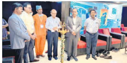
న్యూరో వైద్య సదస్సును ప్రారంభిస్తున్న డాక్టర్ల సమూహం, మాన్వల్ హిల్స్