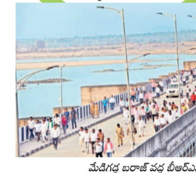
మేడిగడ్డ బరాజ్ వద్ద బీఆర్ఎస్ శ్రేణులు

చలో మేడిగడ్డ కార్యక్రమం పోలీసుల తీరుతో కొద్దిసేపు ఉద్రిక్తంగా మారింది. కేటీఆర్ బృందం వెళ్తున్న నేపథ్యంలో అక్కడికి చేరుకున్న బీఆర్ఎస్ కార్యకర్తలను పోలీసులు బ్రిడ్జి మెయిన్ గేట్ మూసివేసి అనుమతించకపోవడంతో కార్యకర్తలు ఆందోళన చేశారు. మెయిన్ గేట్ తీసుకొని బ్రిడ్జిపైకి వెళ్లడం ప్రయత్నించిన బీఆర్ఎస్ కార్యకర్తలు, పోలీసులకు మధ్య తోపులాట జరిగింది. ఈ క్రమంలో కార్యకర్తలకు స్వల్ప గాయాలయ్యాయి. తొక్కిసలాటలో ఓ మహిళా కార్యకర్త కిందపడింది.