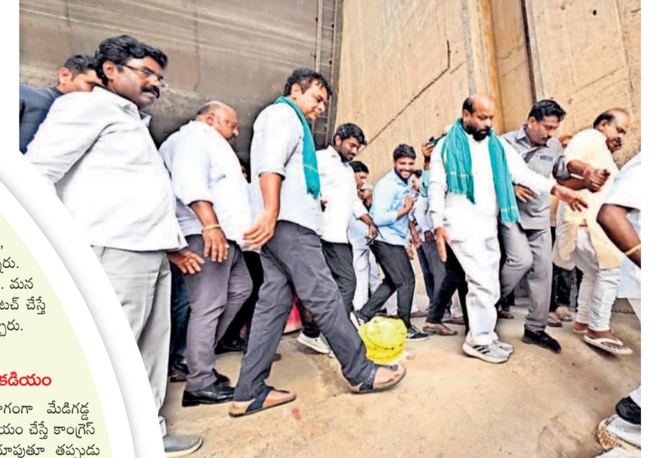
బీఆర్ఎస్ శ్రేణులతో కలిసి మేడిగడ్డ బరాజ్ ను పరిశీలిస్తున్న కేటీఆర్

లింగాలమునపురం, మార్చి 1 : 'బీఆర్ఎస్ శ్రేణులంకా ఓపిక పట్టండి.. ఆరు నెలల్లోనే సీఎం సీటు కోసం కాంగ్రెస్ లో లొల్లి పెట్టుకుంటారు.. ఇప్పటికే చాలా మంది సీనియర్లు కన్ను బుసుగుంటున్నారు.. ప్రజలకి కిచ్చిన హామీలు అమలు చేయలేక.. సొంత కుంభకోణం ఆగం చేస్తున్నారని మాజీ మంత్రి ఎర్రబెల్లి దయాకరరావు అన్నారు. బీఆర్ఎస్ పార్టీని ప్రెసిడెంట్ కేటీఆర్ నేతృత్వంలో శుభవారం చేపట్టిన మేడిగడ్డ యాత్ర హైదరాబాద్-వరంగల్ హైవేపై నిల్వైతూ జైపాస్ వద్దకు చేరుకోగా పార్టీ శ్రేణులు ఘన స్వాగతం చలిచాయి. ఈ సందర్భంగా ఎర్రబెల్లి దయాకరరావు మాట్లాడుతూ ప్రాజెక్టులను కొల్లగొట్టిన సంస్కృతి కాంగ్రెస్ నినాదాలు, ఎన్ఆర్ఎస్ కాల్య తవ్వకాలను బాధి ప్రాజెక్టు నిర్మాణ సమయంలో తాను తెలంగాణ ప్రయోజనాల కోసం ఉద్యమించానన్నారు. ఎన్నికలకు ముందు ప్రజలకి బిచ్చం అరుగులు తియడం అమలు చేయలేక కాంగ్రెస్ పార్టీ నేతలు కాశీశ్వరంపై కట్టు కడలు ప్రచారం చేస్తున్నారని ఆయన విమర్శించారు. బీఆర్ఎస్ కార్యకర్తలు ఎక్కడా నిలిచి కాశీశ్వరం ప్రాజెక్టుపై వాస్తవాలను