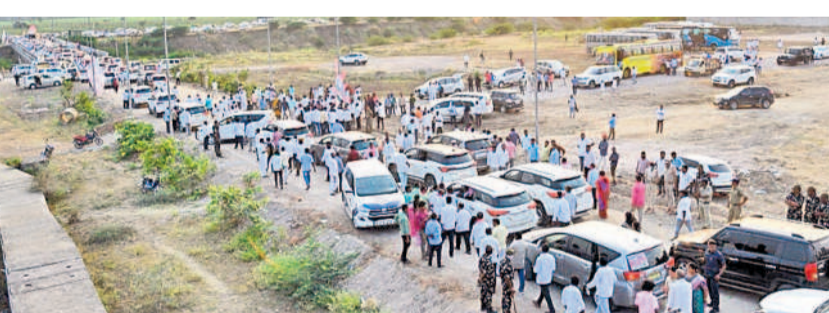
మేడిగడ్డ బరాజ్ వద్ద బీఆర్ఎస్ నాయకులు

గ్రామాల్లో ప్రజలకు వివరించాలన్నారు. ప్రజా సంస్కృతిపై బీఆర్ఎస్ నాయకులు ప్రశ్నిస్తుంటే అక్కడ మంగా కేసులు పెడుతున్నారని, దీనికి తాము భయపడమన్నారని, 'మనం ఎవరి తెరుపు పోవొద్దు.. మన తెరుపుకు వస్తే ఊరుకోవద్దు.. టవ్ చేస్తే తాట తీద్దాం..' అని పిలుపునిచ్చారు.