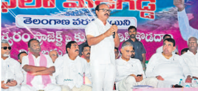
అన్నారం బరాత్ వద్ద ఏర్పాటు చేసిన సమావేశంలో మాట్లాడుతున్న లక్షల్లో ఎన్ఈ వెంకటేశం

నీరు ఇచ్చిందని కడియం శ్రీహరి తేల్చి చెప్పారు. మేడిగడ్డపై కాంగ్రెస్ పార్టీ దివానా కోరు రాజకీయం చేస్తున్నదని, రాజకీయంగా కాంగ్రెసు ఎలా ఎదుర్కోవాలి? బీఆర్ఎస్, కేసీఆర్లకు బాగా తెలుసని చెప్పారు. మేడిగడ్డ బరాత్ను వెంటనే పునరుద్ధరించాలని, వాన కాలంలో వచ్చే వరదలకు మేడిగడ్డ బరాత్ను ఏర్పాటు అయితే రాష్ట్ర ప్రభుత్వానిదే బాధ్యతని స్పష్టం చేశారు. మేడిగడ్డ బరాత్పై ఎలాంటి విచారణకైనా బీఆర్ఎస్ సిద్ధమేనని, బాధ్యత ఎలాంటి చర్యలైనా తీసుకోవచ్చని తెలిపారు. కాశీశ్వరం ప్రాజెక్టులో ఒక భాగమైన మేడిగడ్డ బరాత్లో కొన్ని పిల్లలు కుంగిపోయాయని, దీంతో గత ప్రభుత్వంపై రాజకీయ దాడి చేయాలని కాంగ్రెస్ చూస్తున్నదని, అసలు ఆ నిర్మాణమే పనికి రాదన్నట్లు కాంగ్రెస్ వ్యవహారిస్తున్నదని కడియం ద్వారా తెలిపారు. కేసీఆర్ అదేలా మేకే తాము ప్రాజెక్టును సందర్శించామని, వాస్తవాలను ప్రజలకు చెప్పాలన్న ఆయన ఆలోచనతోనే మేడిగడ్డకు తరలివచ్చామని చెప్పారు. బీఆర్ఎస్ మేడిగడ్డ యాత్రకు పోటీగా కావాలనే కాంగ్రెస్ నేతలు పాలమూరు పర్యటన పెట్టుకున్నారని, తాము వాస్తవాలను చెప్పడానికే వచ్చున్నామని తెలిపారు. గత రాజకీయం యాత్రలు ఎందుకు చేస్తున్నారని ప్రశ్నించారు.