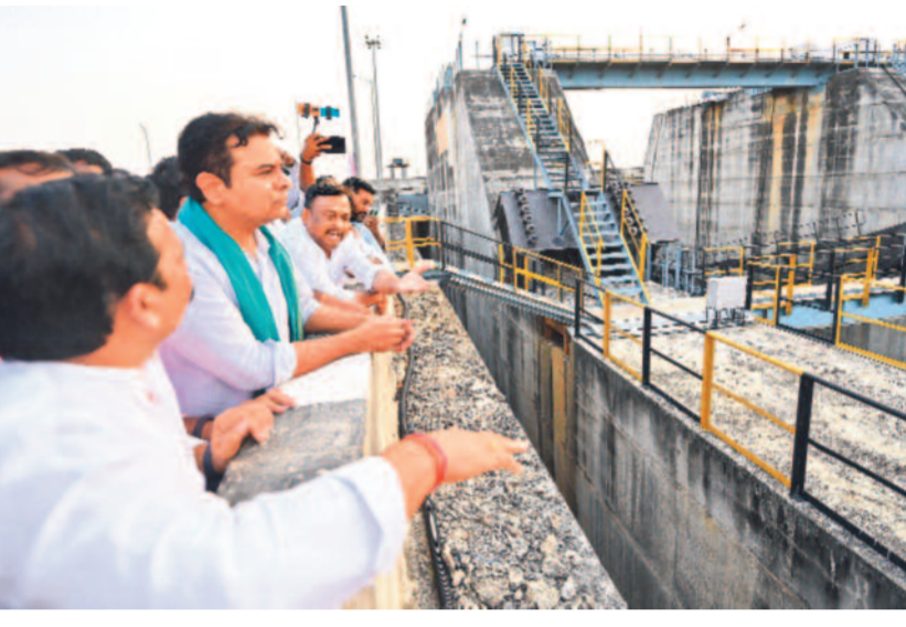
అన్నారం ప్రాజెక్టును పరిశీలిస్తున్న కేటీఆర్