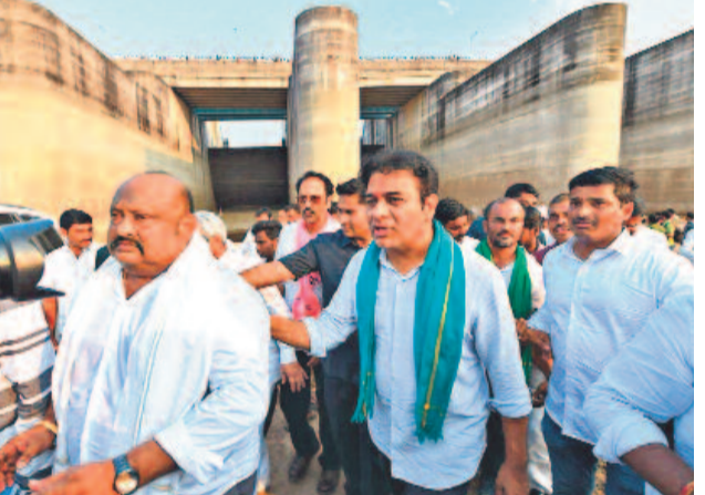
మేడిగడ్డ వద్ద కేటీఆర్, ఎమ్మెల్యేలు మాగంటి గోపీనాథ్, గంగంల కమలాకర్