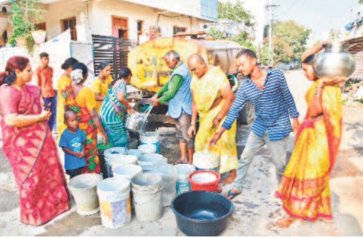
22వ డివిజన్ సుభాషినగర్లో సగర పాలక సంస్థ ట్యాంకర్ నీటిని పట్టుకుంటున్న కాలనీవాసులు

ఇంకా వేసవి ఆరంభం కానేలేదు. ఎండలు ముదదనే లేదు. కానీ, అప్పుడే కరీంనగర్ లో నీటి కటకట మొదలైంది. నాలుగైదేండ్లుగా లేని నీటి సమస్య మళ్ళీ ఇబ్బంది పెడుతున్నది. పది పదిహేను రోజులుగా హైలెవల్ జోన్ లోని ఏడు డివిజన్ల ప్రజలు నల్లని నీటిని అప్పుడు వస్తుందా? అని ఎదురుచూస్తున్నారు. రోజూ విడిచి రోజూ నీటిని సరఫరా చేస్తుండడం, అది లోపైపై తో ఇస్తుండడంతో సరిపోక ట్యాంకర్ల కోసం పడిగాపులు గాస్తున్నారు. గతంలో కేసీఆర్ సర్కారు అర్బన్ మిషన్ భగీరథతో తాగునీటి కష్టాలు తీర్చింది. మండలంలోని రోజూ నీటిని సరఫరా చేసేందుకు మున్సిపల్ కార్పొరేషన్ ప్రతి రోజూ నీటిని సరఫరా చేసి మరీ ఇబ్బంది పెట్టడం వల్ల ప్రజలకు అసౌకర్యం కలిగింది. ఇప్పుడు మున్సిపల్ కార్పొరేషన్ ప్రతి రోజూ నీటిని సరఫరా చేసి మరీ ఇబ్బంది పెట్టడం వల్ల ప్రజలకు అసౌకర్యం కలిగింది. ఇప్పుడు మున్సిపల్ కార్పొరేషన్ ప్రతి రోజూ నీటిని సరఫరా చేసి మరీ ఇబ్బంది పెట్టడం వల్ల ప్రజలకు అసౌకర్యం కలిగింది.