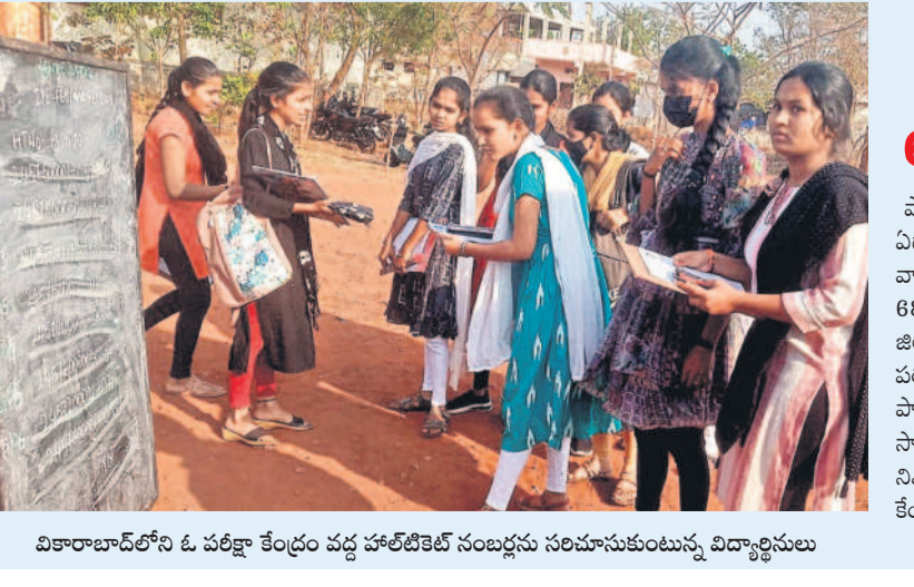
వికారాబాద్లోని ఓ పరీక్షా కేంద్రం వద్ద హాల్టింగ్ నేపథ్యం సరిచూసుకుంటున్న విద్యార్థులు