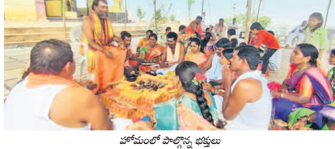
హోమంలో పాల్గొన్న భక్తులు

చేష్టాటోన్, ఫిబ్రవరి 29: చేష్టాటోన్ కొనగట్టు శివాలయం, శ్రీ బ్రహ్మరంభ సమేత మల్లికార్జున స్వామి ఆలయంలో వార్షిక బ్రహ్మోత్సవాలు రెండవ రోజు గురువారం ఘనంగా నిర్వహించారు. ఉదయం రుద్రాభిషేకం, సహస్ర బిరూర్లు. అమ్మవారికి సహస్ర