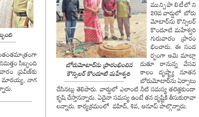
నీటి సమస్య తలెత్తకుండా కృషి చేస్తా