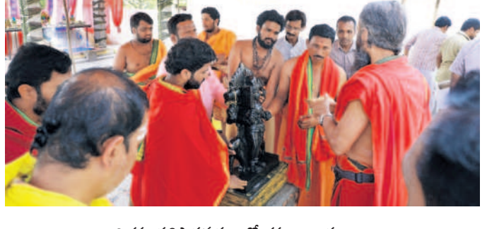
విగ్రహ ప్రతిష్ఠాపన పూజల్లో భక్తులు, బ్రాహ్మణులు