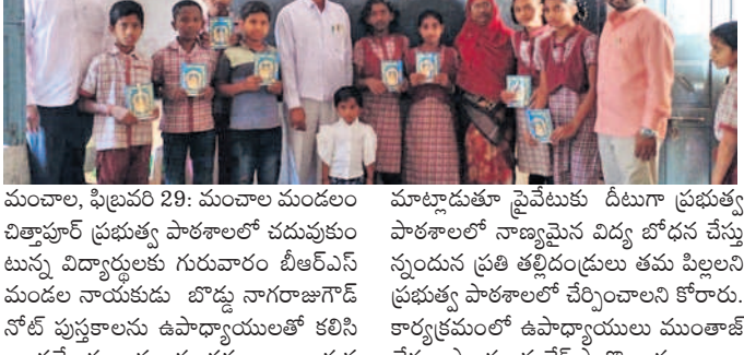
విద్యార్థులకు నోట్ పుస్తకాల పంపిణీ