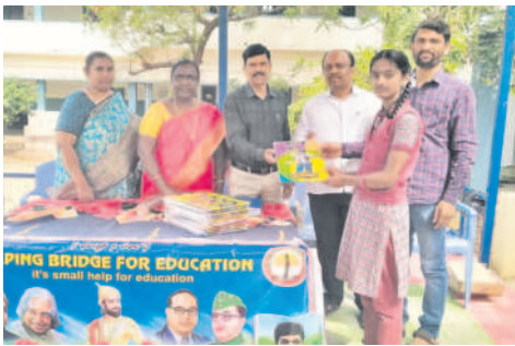
విద్యార్థులకు పరిశ్రమ ప్రాజెక్టులను పరిచయం చేస్తున్న ఎంకేవో

రాజంపేట్, ఫిబ్రవరి 29 : సమయాన్ని సద్వినియోగం చేసుకోని ఆభ్యుదయంతో చదివి వంద శాతం ఫలితాలు సాధించాలని మండల విద్యా ఉపాధ్యాయులు పాల్గొన్నారు.