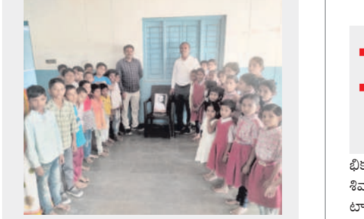
నివాసాలపై స్టూడెంట్ల పాఠశాల నిర్మాణం, విద్యార్థులు