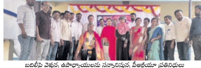
బలిపల్లి వెళ్తున్న ఉపాధ్యాయులను సన్మానిస్తున్న పీఆర్డీయూ ప్రతినిధులు