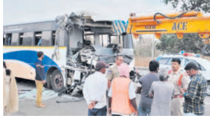
ధ్వంసమైన బస్సు ముందు భాగం

భిక్కనూరు, ఫిబ్రవరి 29 : మండలంలోని జంగంపల్లి శివారులో ఉన్న జాతీయ రహదారిపై ఆర్టీసీ బస్సు వాటర్ ట్యాంకర్ను ఢీకొన్నా. డ్రైవర్తోపాటు వది మంది ప్రయాణికులకు గాయాలయ్యాయి. ఈ ఘటన గురువారం కోటుచేసుకొన్నా. ఇందుకు సంబంధించి ఎస్పీ సాయికుమార్ తెలిపిన వివరాల ప్రకారం, జంగంపల్లి శివారులో ఉన్న ఏ వన్ హర్వారు దాబా ఎదురుగా జాతీయ రహదారిపై ఉన్న డివైడర్లలోని మొక్కలకు జీవించి సంస్కృత చెందిన వాటర్ ట్యాంకర్ ద్వారా సిబ్బంది స్ట్రక్చురు పోసుకుంటూ వెళ్తున్నారని తెలిపారు. ఈ క్రమంలో నిర్వహించిన చర్యల ఫలితంగా ఆర్టీసీ బస్సు వాటర్ ట్యాంకర్ను ఢీకొంది. ఈ ప్రమాదంలో బస్సు డ్రైవర్ తీవ్ర గాయాలకు గురైనట్లు తెలిపారు.