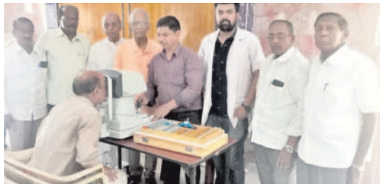
కంటి పరిశీలన చేస్తున్న వైద్య సిబ్బంది