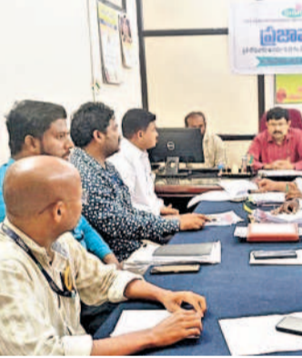
యూసెఫ్ గూడలోని జిహెచ్ఎంసీ కార్యాలయంలో ఆస్తిపన్ను అభివృద్ధి నిర్వహించిన సమావేశంలో మాట్లాడుతున్న డి.పి. సేనా ఇన్చార్జ్

జూబ్లీహిల్స్, ఫిబ్రవరి 29: ఆస్తిపన్నుకు 2022-23 వరకు ఉన్న పాత బకాయిలపై 90 శాతం తగ్గింపు ఇస్తున్నట్లు డిప్యూటీ కమిషనర్ సీఎంరేవంకరెడ్డి తెలిపారు. యూసెఫ్ గూడలోని జిహెచ్ఎంసీ కార్యాలయంలో అధికారులు, ప్రత్యేక బృందాలతో గురువారం సమావేశం నిర్వహించారు. నగర పాలక సంస్థ ఆస్తిపన్ను బకాయిల వడ్డీపై 90 శాతం తగ్గింపు ప్రకటించినట్లు, మార్చి 31 వరకు పాత బకాయిల వడ్డీపై 90 శాతం తగ్గింపు ఉంటుంది. యూసెఫ్ గూడలోని జిహెచ్ఎంసీ కార్యాలయంలో ఆస్తిపన్ను అధ్యక్షుడు, అభివృద్ధి నిర్వహించిన సమావేశంలో మాట్లాడుతున్న డి.పి. సేనా ఇన్చార్జ్