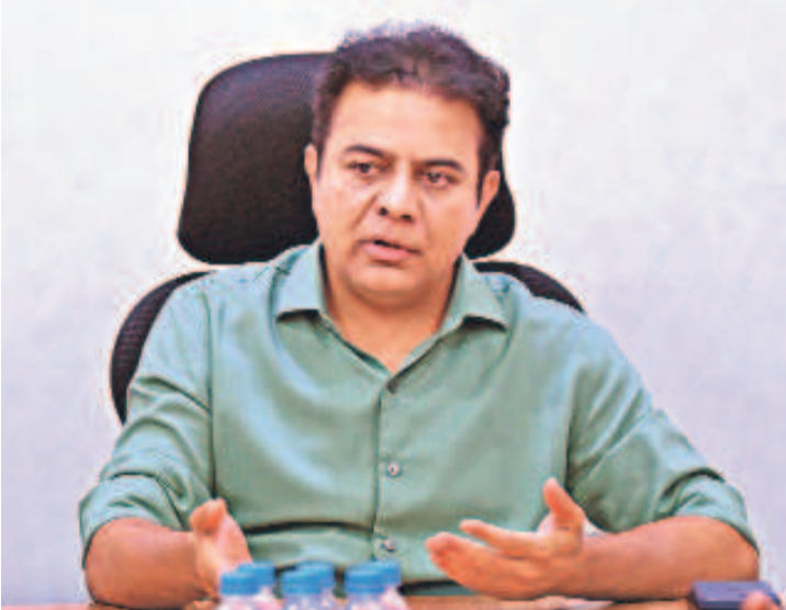
అంపీగా సీట్టింగ్ స్థానం మల్కాజిగిరిలోనే కొట్టడంకాదు రా. సెట్టింగ్ ఎంపీగా సీట్టింగ్ స్థానం మున్సిపల్ శాఖ మంత్రిగా నా పరిస్థితిలోనే తెలుగుకుండాం. సీఫీగా ఆదాద్ది. రెండు పదవులకు రాజీనామా చేసే రా.. నువ్వు గెలుస్తావా.. నేను గెలుస్తావా చూద్దాం. -కేటీఆర్

రేపంత్ రెడ్డికి నిజంగా అంత ఉబలాటమే ఉండే.. ఆయనకు నేను కూడా సవాలు చేస్తున్నాను. నువ్వు రా. సీఎం పదవికి, కొడంగల్ ఎమ్మెల్యే పదవికి రాజీనామా చెయ్యి. నేను కూడా నా ఎమ్మెల్యే పదవికి రాజీనామా చేస్తా. మల్కాజిగిరి లోకొనభవ ఇద్దరం పోటీపడాలి.. మల్కాజిగిరి ఎంపీగా నీకు సెట్టింగ్ స్థానం కదా.. ఆ ఒక్క సీటు గెలుపు. చూస్తూ. రేపంత్ రెడ్డి పోటీపెట్టే.. నేనే ఆయనపై పోటీచేస్తా. నా సవాలును ఆయన స్వీకరించాలి." అని కేటీఆర్ సవాలు విసిరారు. ఎవరి కెన్ని సీట్లు అన్నది ప్రజలు తెలుస్తారని, మూడైతే