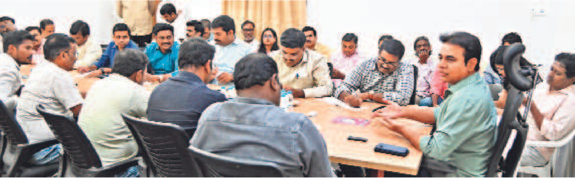
తెలంగాణ భద్రాచలంలో మిడియా బిల్డర్లతో మాట్లాడుతున్న బీఆర్ఎస్ వర్కంగ్ ప్రెసిడెంట్, ఎమ్మెల్యే కేటీఆర్