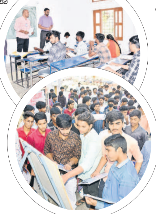
నిజామాబాద్లో ఓ కేంద్రం వద్ద సంబంధ మూసుకుంటున్న విద్యార్థులు