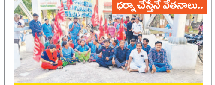
ధర్మా చేస్తేనే వేతనాలు..