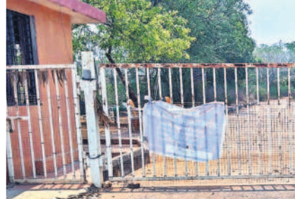
పోచంపల్లి హ్యాండ్లూమ్ పార్కు ద్వారం

2008లో కేంద్ర ప్రభుత్వం సీమీ ఫర్ ఇంటిగ్రేటెడ్