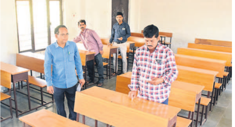
యాదగిరిగుట్ట ప్రభుత్వ జూనియర్ కాలేజీలో హాల్ టెక్నెట్ నెంబర్లు చేస్తున్న పరీక్షల సిబ్బంది

మండపంలో శ్రీవారికి ఉదయం నుంచి సాయంత్రం వరకు పలు దఫాలుగా భక్తులతో సువర్ణపుష్పార్చన జరిపించారు. బంగారు పుష్పాలతో దేవేరులకు అర్చన చేశారు. సాయంత్రం స్వామి వారికి తిరువీధి సేవ, దర్వాజ్ సేవ ఘనంగా నిర్వహించారు. పాత గుట్టలో స్వామివారికి నిత్యారాధనలు వైభవంగా సాగాయి. ప్రధానాలయం, కళ్యాణం, శివాలయంలో చెంత గల క్షేత్రపాలకుడు అంజనేయస్వామికి ఆకుపూజను ఘనంగా నిర్వహించారు. హనుమంతుడిని సింధూరంతో అలంకరించి అభిషేకించి లలితాపారాయణం చేశారు. ఉదయం నుంచి సాయంత్రం వరకు దర్శనాలు కొనసాగాయి. సుమారు 10 వేల మంది భక్తులు స్వామివారిని దర్శించుకున్నట్లు ఆలయ అధికారులు వెల్లడించారు. అన్ని విభాగాలు కలుపుకొని స్వామివారి ఖజానా రూ. 25,10,779 అదాయం సమకూరిందని ఆలయ కుటుంబం ప్రకటించింది.