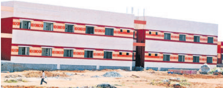
నిరుపయోగంగా మారిన హ్యాండ్లూమ్ పార్కు భవనం

'పోచంపల్లి హ్యాండ్లూమ్ పార్కును బీఆర్ఎస్ ప్రభుత్వం అణచివేసింది. దీనిని తెలుగు ప్రభుత్వం అప్పుడు అప్పుడు... బీజేపీ తీసుకుని వచ్చిన సర్కారులు కేసీఆర్ కొనుగోలు చేస్తున్నారు. రూ. 12.50 కోట్లకు కొని హ్యాండ్లూమ్ పార్కును కొన్నాం. దీన్ని బ్రహ్మాండంగా రూపుదిద్దాం. అవసరమైతే మరో రూ. 15 కోట్ల ఖర్చు చేస్తాం. అందులో నుంచి వచ్చే లాభాలను పోచంపల్లి మండలంలోని ప్రతి నేత కుటుంబానికి అందజేస్తాం. పార్కుపై ఓనర్షిప్ నేతలకే ఒప్పజెప్పాం'