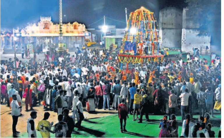
స్వామివారి రథోత్సవంలో పాల్గొన్న భక్తులు

పరీక్షల కోసం జిల్లాలో 30 నింట్లను ఏర్పాటు చేశారు. రాజాపేట, మోతూర్, యాదగిరి గుట్టలో సెల్స్ నింట్లను అనుమతి ఇచ్చారు. మొత్తం 12,559 మంది విద్యార్థులు పరీక్ష రాయనున్నారు. ఇందులో ప్రథమ సంవత్సరం 6,109