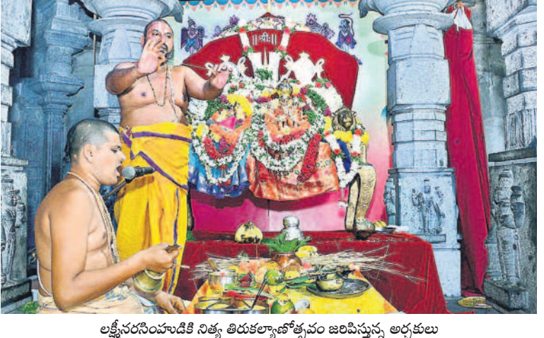
లక్ష్మీనరసింహుడికి నిత్య తిరుకల్యాణోత్సవం జరిపిస్తున్న అర్చకులు